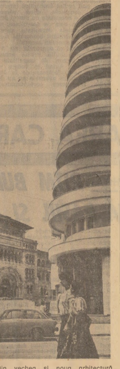
Din vechea și noua arhitectură a Bucureștilui.

ideea că fiecare primește de la societate în raport cu contribuția sa concretă la progresul acesteia. Activitatea politică-educativă trebuie să formeze convingerea profundă că munca reprezintă unica sursă a sporirii avuției naționale, a înfloririi patriei, a prosperității poporului și a bunăstării și feteții personale, condiția hotărîtoare a afirmării personalității umane. În timpul dezbaterii acestui proiect de program, ca și a celorlalte pro-