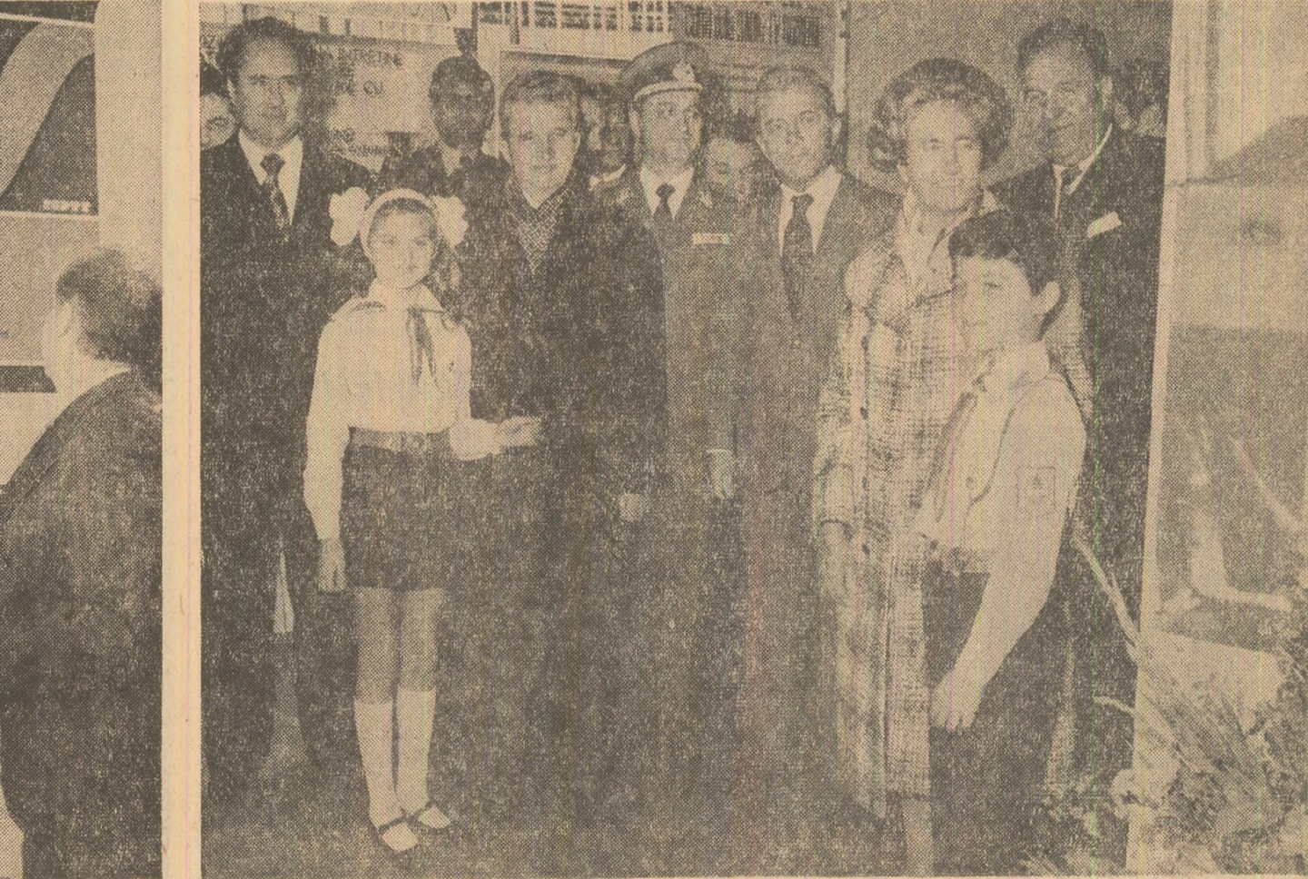
La standul Radioteleviziunii