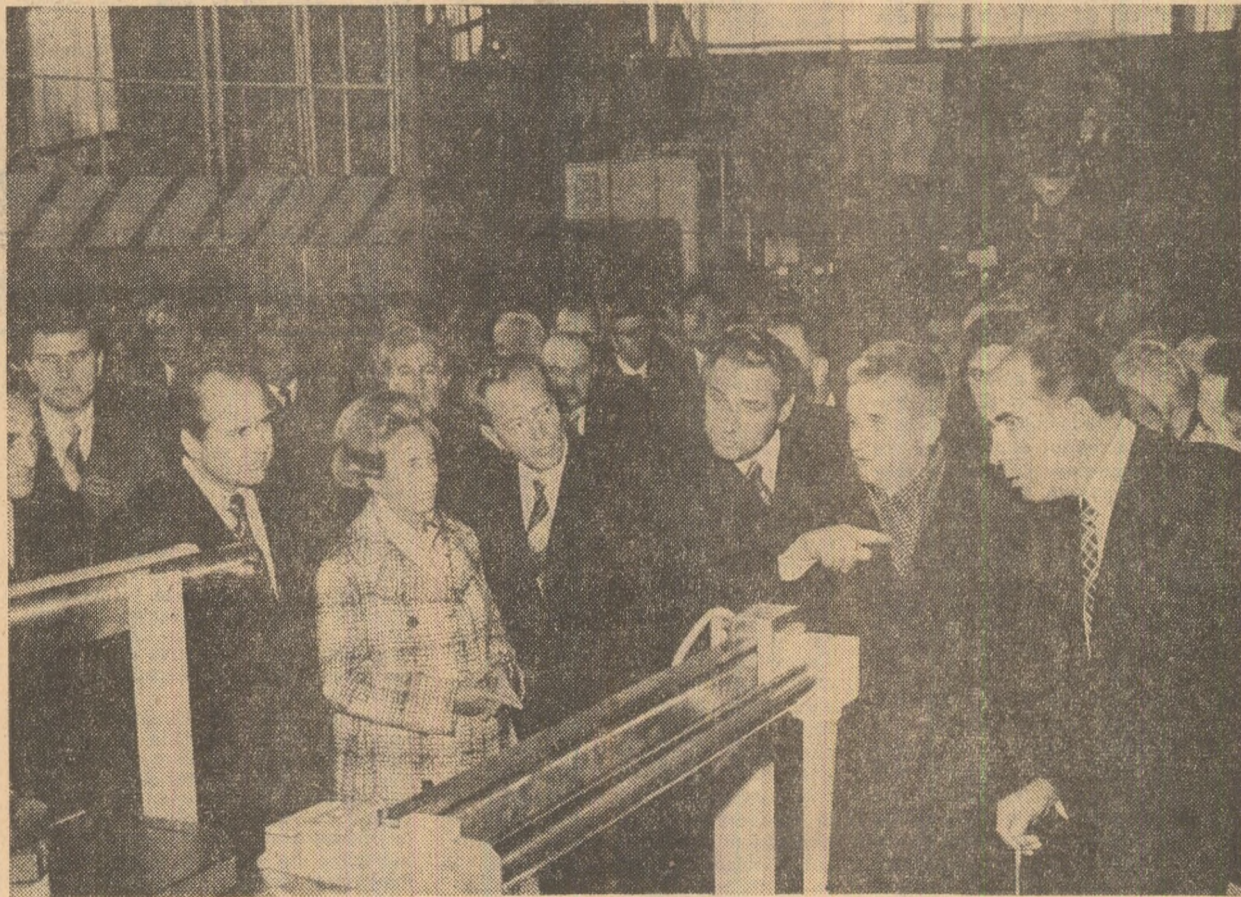
Constructorii de mașini prezintă produse de înaltă tehnicitate