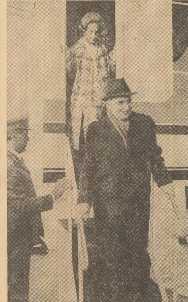
În sectorul mijloecelor de transport pe căile ferate

Numai în primii trei ani ai cîncinalului s-a obținut în medie, anual, o producție agricolă cu 24 la sută mai mare decît media anuală din perioada 1971—1975, realizîndu-se un ritm de creștere de 7,5 la sută față de 6,9—9 la sută, nivelul prevăzută în Programul suplimentar adoptat de Conferința Națională a partidului. Ilustrativ este demonstrată în cadrul expoziției contribuția chimiei la creșterea fertilității pămîntului, folosindu-se, în prezent, de patru ori mai multe îngrășăminte decît în anul 1970. În slujba agriculturii se află zeci de institute și stațiuni de cercetări numărînd aproape 3 000 de cercetători, care, în colaborare cu cei peste 38 000 de ingineri din producție,