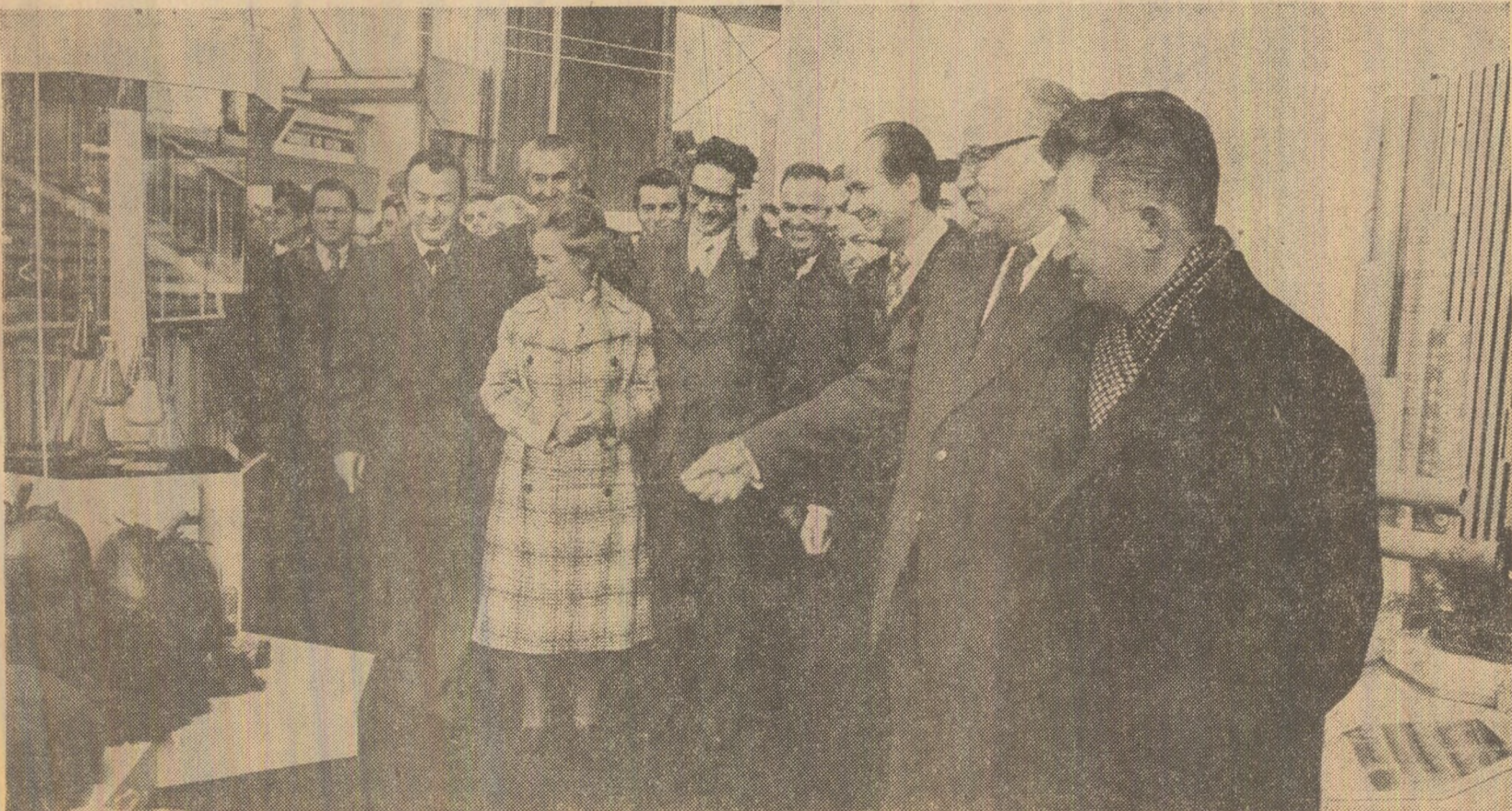
Se vizitează standurile Industriei chimice

Asistă șefi ai misiunilor diplomatice acreditate la București și alți membri ai corpului diplomatic, precum și corespondenți ai presei străine.