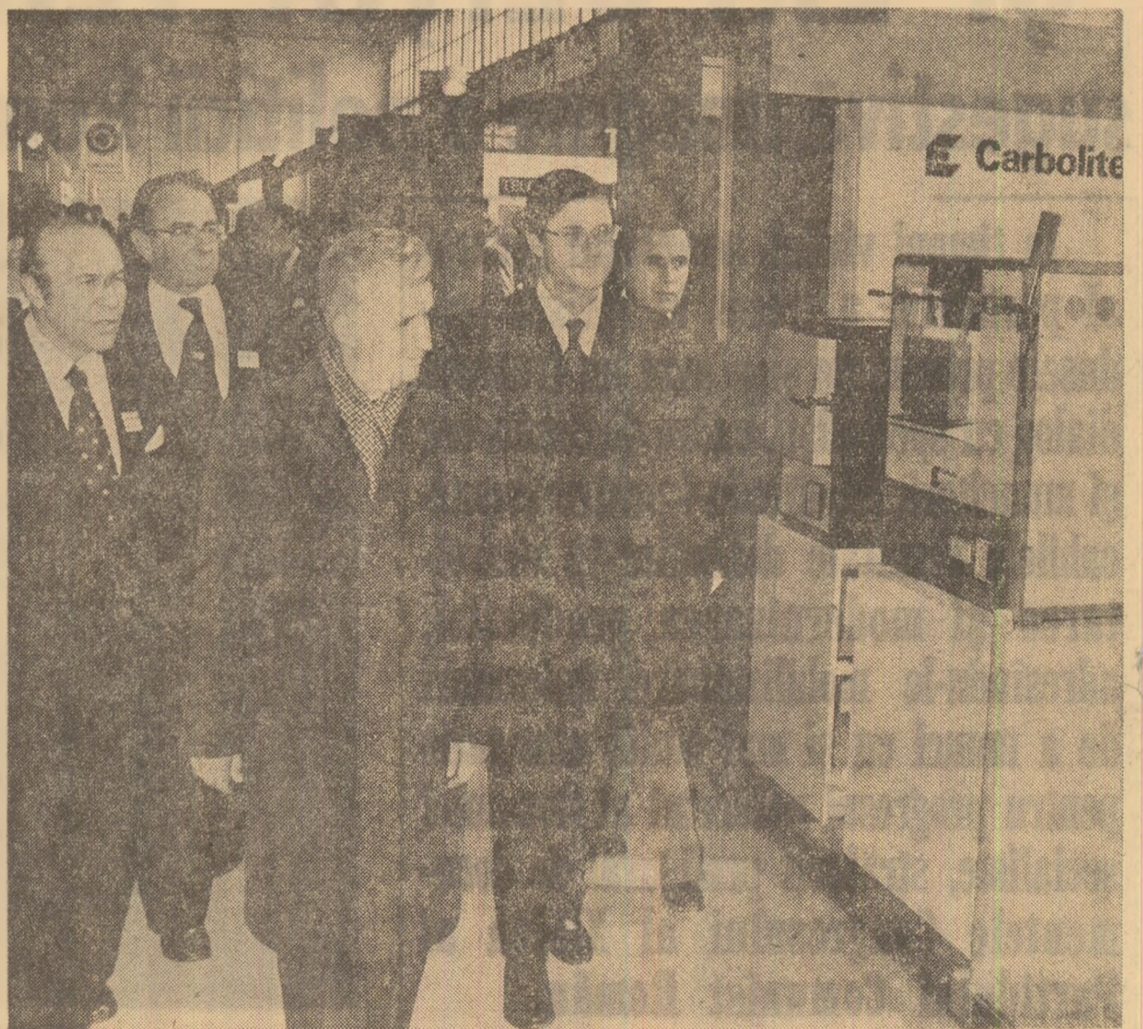
În sectorul firmelor britanice