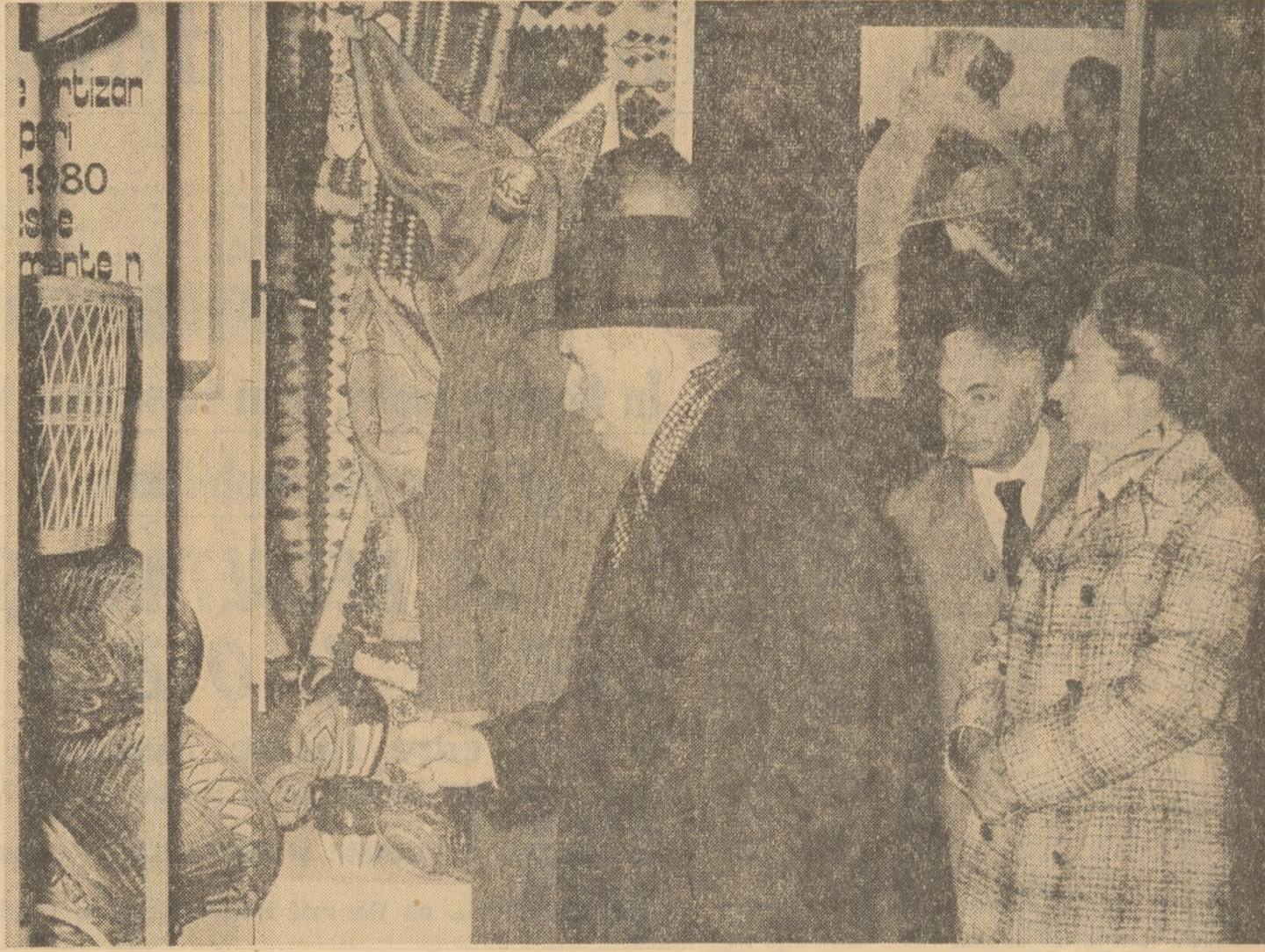
Produce artizanale executate cu îndeminare și simț artistic