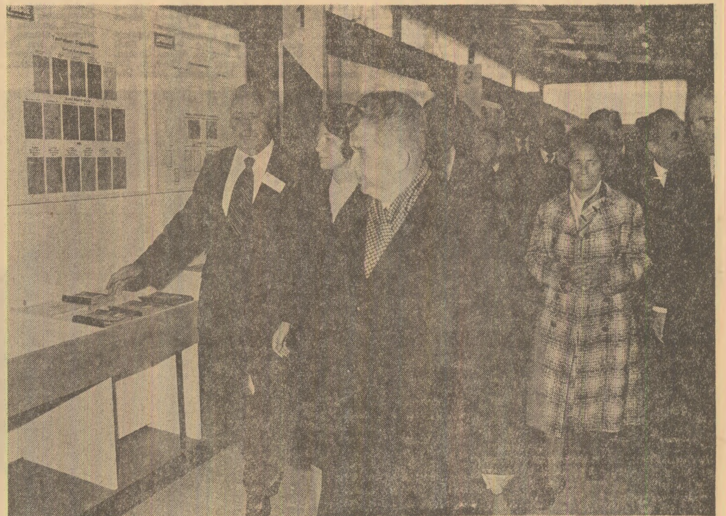
În pavilionul S.U.A.