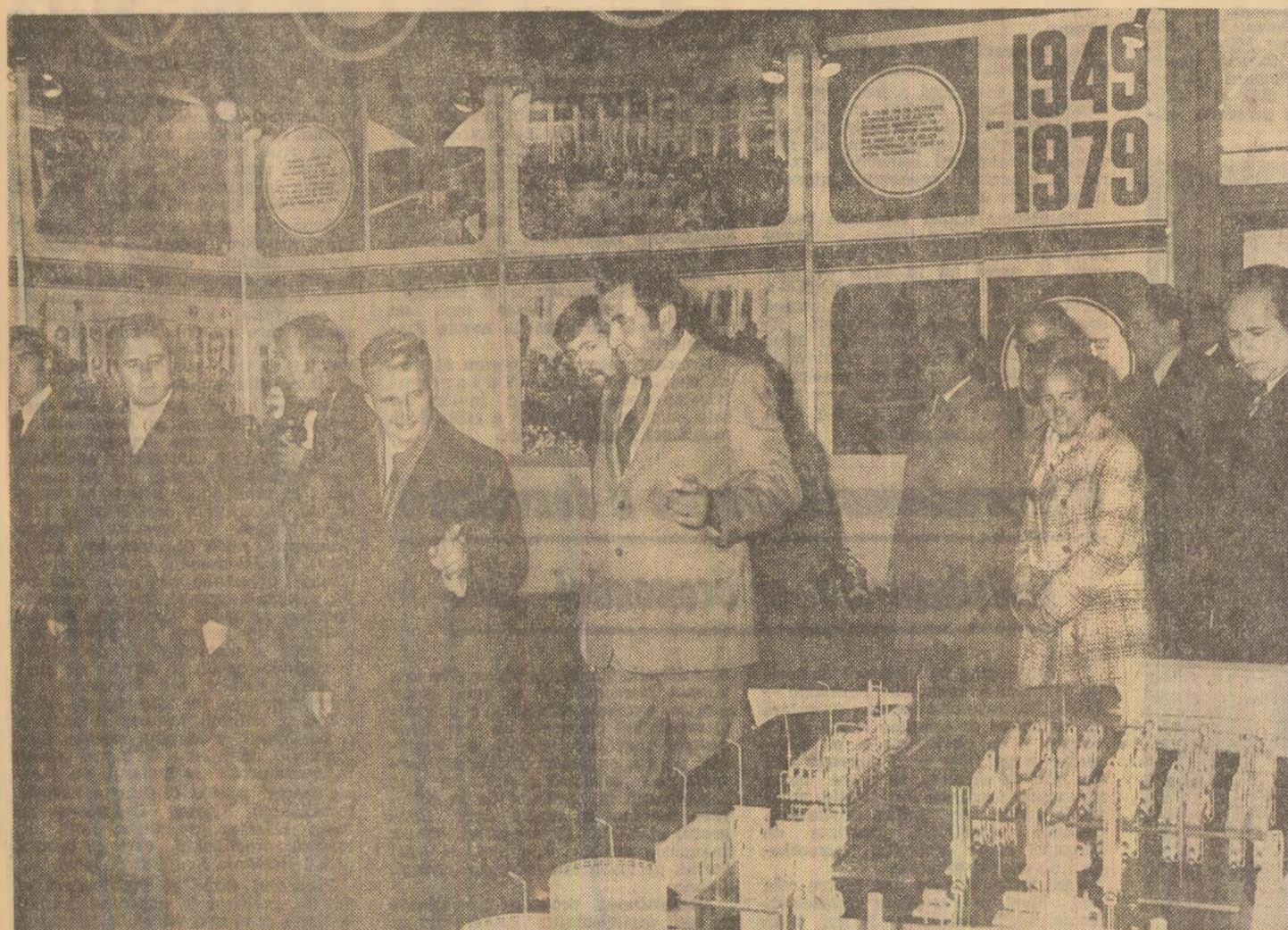
În pavilionul U.R.S.S.