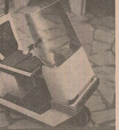
Electromobil-proiect (Alexandru Vlădescu)