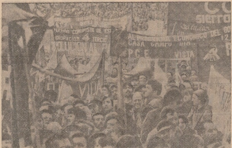
La Madrid a avut loc o mare demonstrație populară (fotografia de sus) la care au participat aproape 400 000 de persoane. Demonstrații au reventat imbușnățirea condițiilor de muncă și de viață, reducerea șomajului

asupra supraprofiturilor companiilor petroliere. În versiunea adoptată de Senat însă, proiectul de lege ar urma să furnizeze în următorii șase ani fonduri de numai jumătate din cit se anticipa. „În actuala formă, legea va asigura companiilor petroliere profituri suplimentare de 374 miliarde dolari — a spus Jimmy Carter, iar dacă prețul petrolului este calculat în funcție de rata inflației, aceste profituri vor atinge în următorul deceniu cifra de 1 000 miliarde dolari. Iată de ce, a accentuat președintele, este necesar ca Senatul să adopte o legislație adecvată, care să priveze companiile petroliere de cea mai mare parte a profiturilor lor nejustificate”.