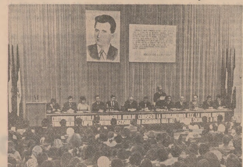
TOVARĂȘUL NICOLAE CEAUȘESCU LA ÎNFRÂNGEREA RĂZBOIULUI MILITAROFASCIST ȘI RĂZBOIULUI

Pe noul stadion din localitatea Iugoslavă Kosovski Mitrovici se va disputa astăzi meciul retur dintre echipele Iugoslaviei și României, fiind pentru prima dată campionatul european de fotbal (grupa a 3-a).