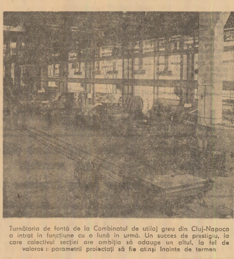
Turnătoria de fontă de la Combinatul de utilaj greu din Cluj-Napoca a intrat în funcțiune cu o lună în urmă. Un succes de prestigiu, la care colectivul secției are adăuga un altul, la fel de valoros: parametrii proiectați sînt deja atinși înainte de termen

Alexandru MURȘAN correspondentul „Șciinteia”