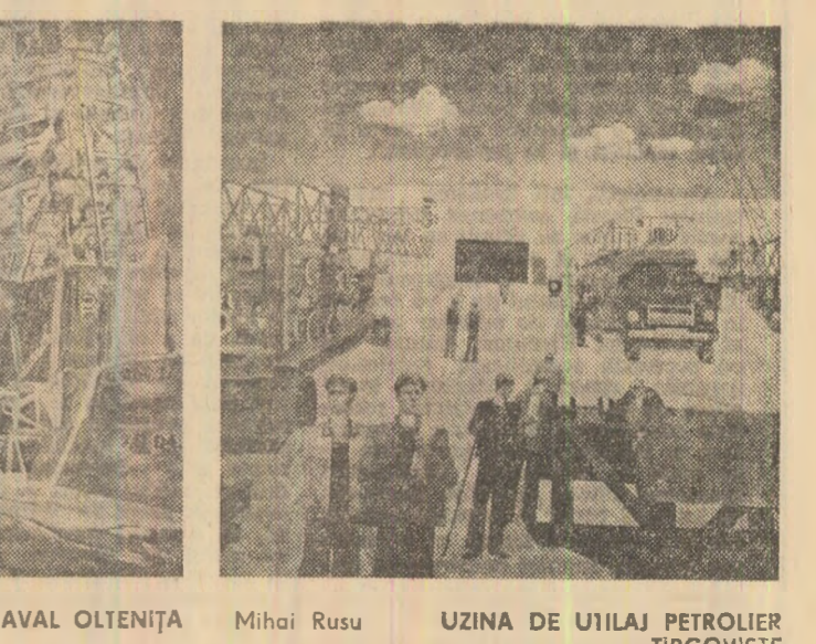
ȘANTIERUL NAVAL OLTEȚIȚA Mihai Rusu UZINA DE UTILAJ PETROLIER TIRGOVIȘTE