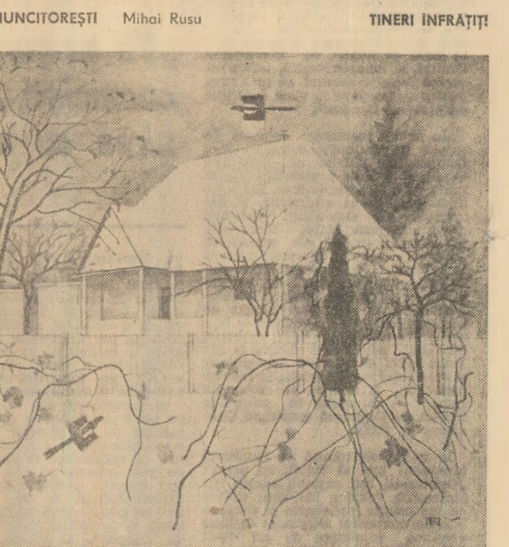
CASA CU VIȚĂ (din ciclul Scornicești)