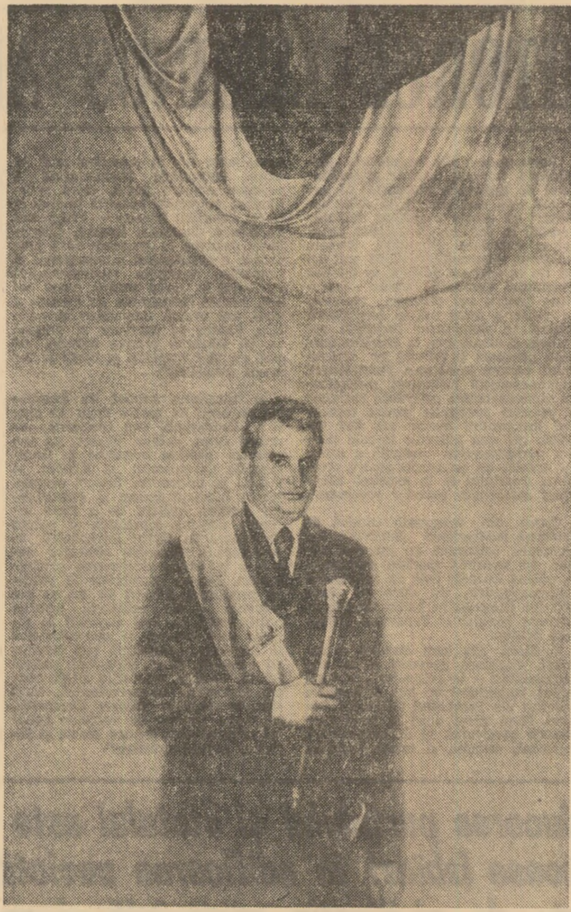
Corneliu Brodușcu TOVARAȘUL NICOLAE CEAUȘESCU