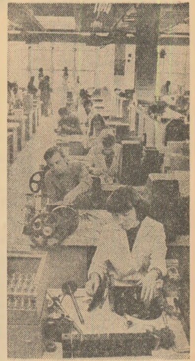
Pentru integrarea învățămîntului cu producția, în incinta Institutului politehnic București s-a construit o întreprindere specializată în producerea de aparate și utilaje destinate activității de cercetare științifică. În fotografie: aspect dintr-unu din secțiile întreprinderii

gradul de returnare a conștientului. Cercetătorii pot aduce contribuții însemnate în sprijinul trecerii cît mai rapide și economice a centralelor termoelectrice) sistemelor a valorilor de pe țărîm Mării Negre, știința trebuie să elaboreze tehnologii pentru utilizarea energiei valurilor. Perfecționarea centralelor termoelectrice bazate pe utilizarea combustibililor inferiori și a sistemelor a fost relevată la Congres ca unul din obiectivele în care cercetarea științifică urmează să acționeze cu hotărîre. Direcțiile sînt multiple, începînd cu modernizarea permanentă a echipamentelor, în sensul mării fiabilității în funcționare a grupurilor ener-