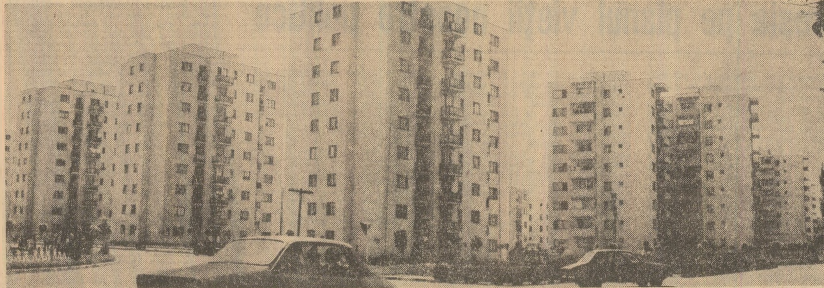
Locuințe noi, moderne la Birlad.