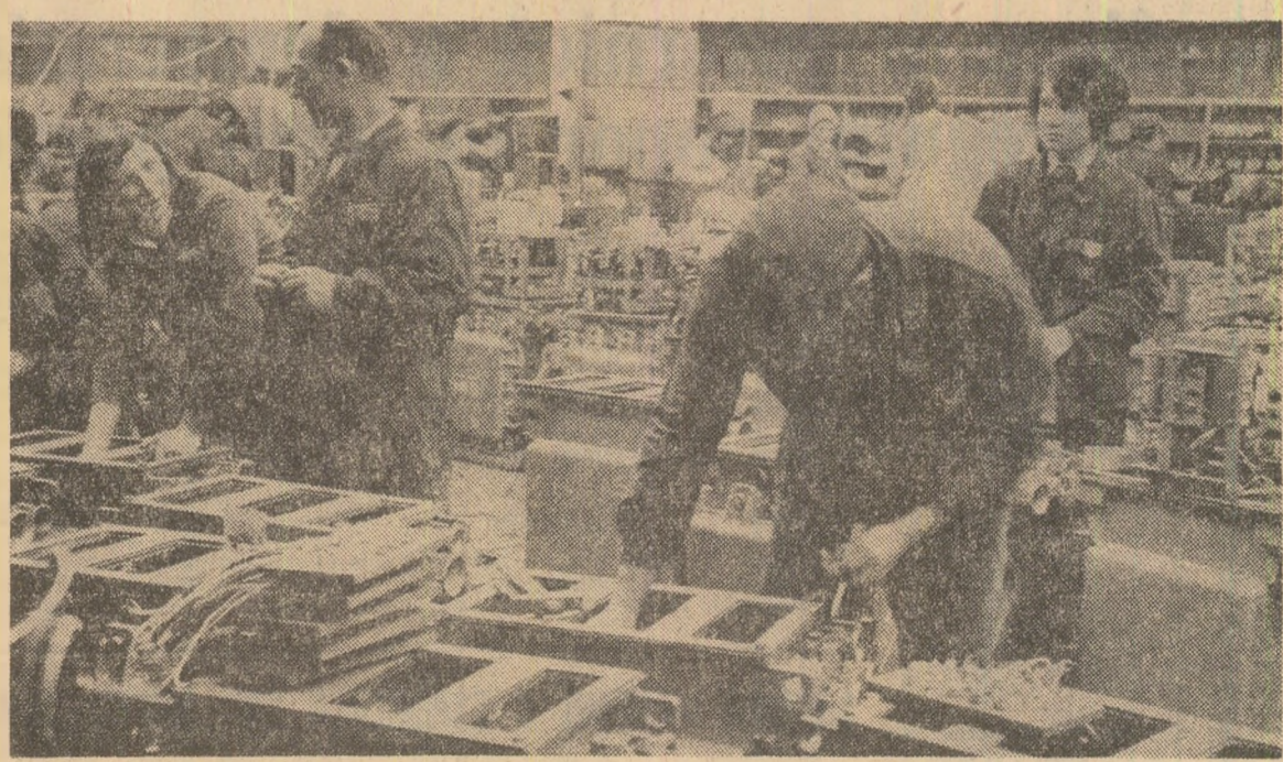
La „Electrocontact” — Botoșani se acționează intens pentru asigurarea decalajului între secțiile de fabricație. În scopul unui bun demaraj al producției în anul care vine

În ceea ce privește îndeplinirea unei sarcini deosebite care revine colectivului întreprinderii noastre — reducerea în continuare a importurilor de componente — asigurarea unui grad mai mare de componente electronice din producția internă este condiționată de asimilarea mai rapidă în fabricație a acestora la I.P.R.S. Băneasa și „Electroarges”.