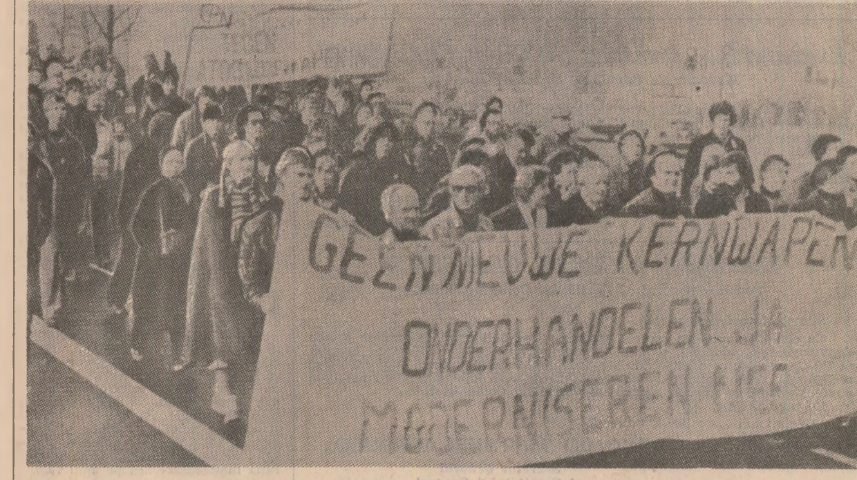
Sub această lozincă, peste 40.000 persoane au demonstrat pe străzile orașului Utrecht (Olanda) împotriva planurilor N.A.T.O. de amplasare a unor rachete...