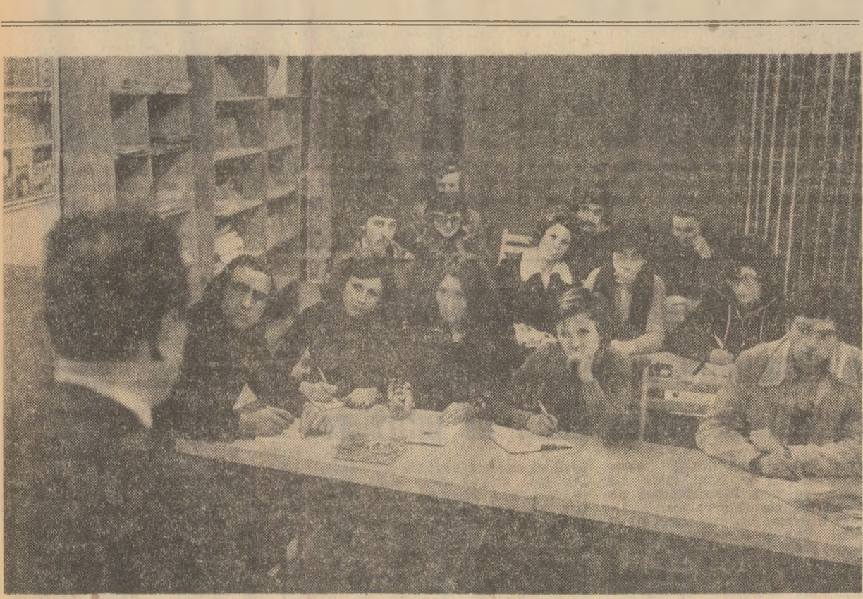
La Casa tineretului din municipiul Tulcea au loc în aceste zile expuneri, conferințe și dezbateri, cu participarea unor cadre didactice, medici, biologi, activiști de partid și de stat, care ajută pe muncitorii constructori, novalisti, pe elevii să-și largască orizontul cunoștințelor politice, științifice și culturale.

Practic, la Conferința sectorului 2 din Capitală a Frontului Unității Socialiste au fost evocate, în primul rînd, un sir de realizări. Reținem, dintre acestea, câteva aspecte bilanțiere, în măsura în care ele conținuț o bază teoretică pentru înfăptuirea proiectelor de viitor.