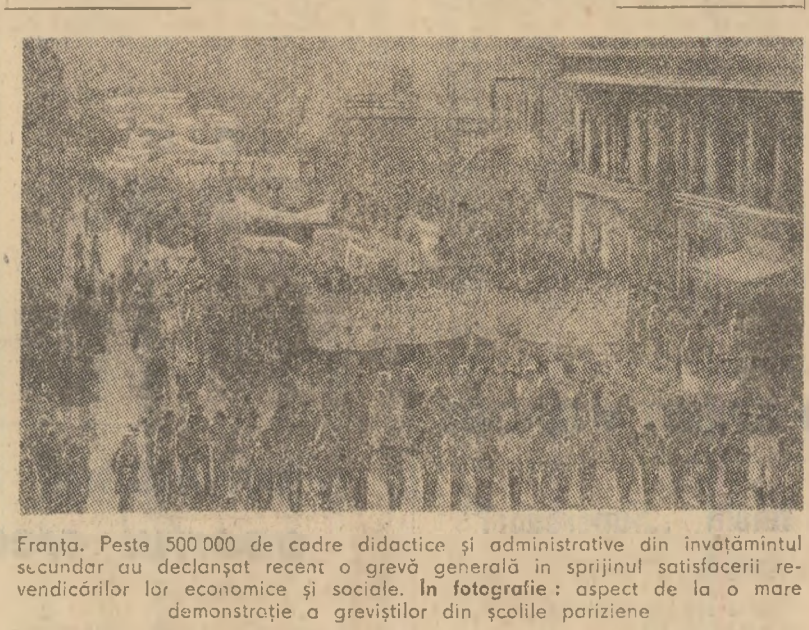
Frânța. Peste 500.000 de cadre didactice și administrative din învățământul secundar au declarat recent o grevă generală în sprijinul satisfacerii revendicărilor lor economice și sociale.

Organizația pentru cooperare și dezvoltare economică (O.E.C.D.) continuă să publice noi prognoze privind evoluția economică a țărilor membre în anul viitor.