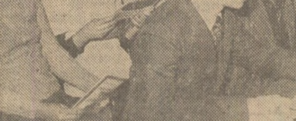
Moment important din activitatea politico-educativă desfășurată în aceste zile în comuna Aluani-Iloș. În lîntuna din stînga cîmînului cultural, cooperatori, elevi în vacanță, lucrători de la cooperativa „Cîmpul” la o expunere cu tema „Documentele Congresului al XII-lea al P.C.R.”.

Am sosit în comuna Urcești tocmai în momentul în care la punctul de informare și documentare avea loc o întâlnire a brigăzii științifice cu numeroși cetățeni pe tema „Miturile și explicația lor științifică”. Care suscita într-un grad înalt interesul participanților. În același timp, în satul Popoști se deschisese o expoziție de carte social-politică. De asemenea, se aflau în plină muncă de creație membrii cercului de artizanat și de artă plastică.