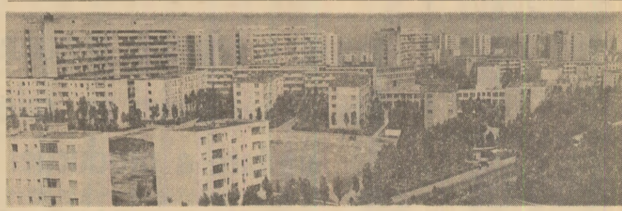
Modernul cartier conștanțean Tomis IV