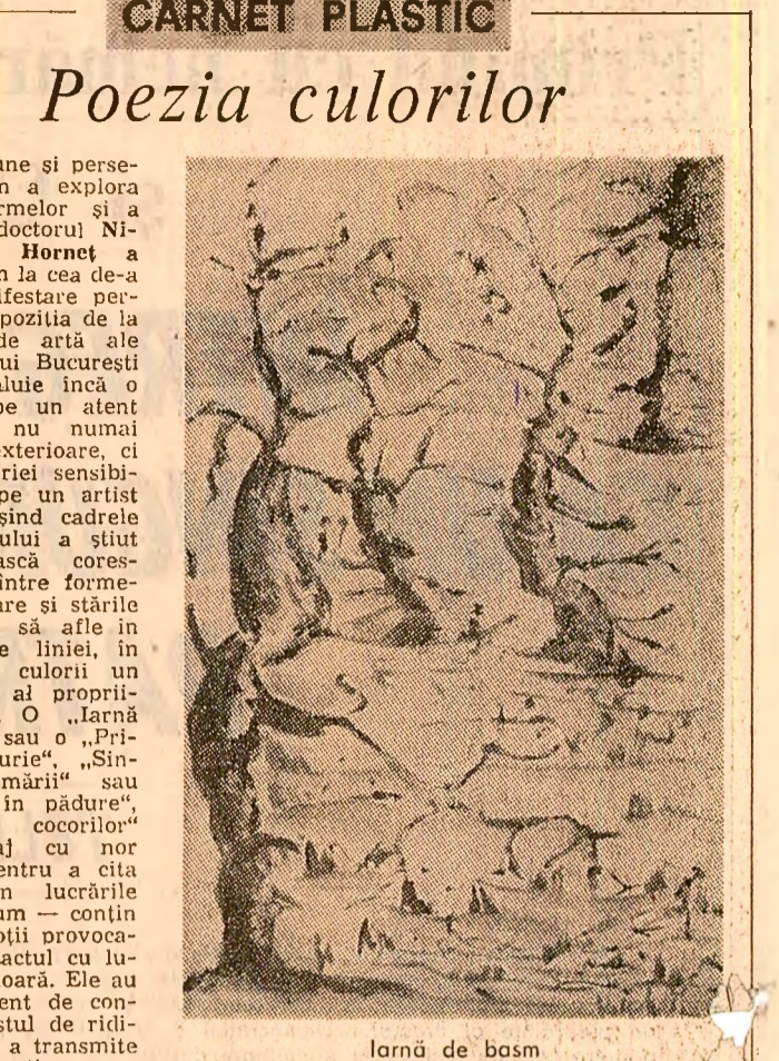
Lomă de basm

fără să distanțeze, cu înțelegerea poetice, de pildă „Framintări”, „Pasuni”, „Cintec”, „Reculegere” asistăm la aceeași sondare a particularului motivat psihologic și vînzînd comunicarea afectivă. Sînt lucrări în care vibrează corzile unei interiorități, ale unei sensibilități reale, lucrări în care mîna artistului nu s-a fixeză ceva din armoniile și dominantele lumii sale lăuntrice. Culoarea amplifică această impresie. Tonerurile luminoase, discrete se învecinează,