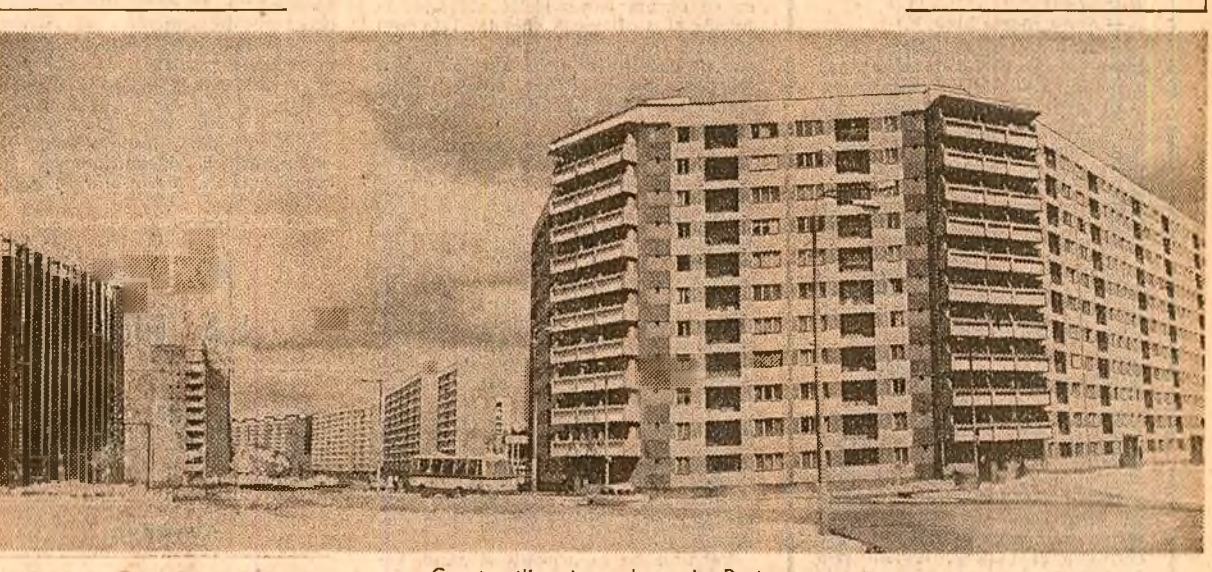
Construcții noi, moderne la Reșița

Primind cu nemărginită bucurie re alegerea ca președinte al Frontului Democratiei și Unității Socialiste a tovarășului Nicolae Ceaușescu ÎNTREG POPORUL SE ANGAJEAZĂ SĂ ACȚIONEZE, CA UN SINGUR OM, PENTRU ÎNFĂPTUIREA ÎNSUFLEȚITOARELOR, PATRIOTICELOR CHEMĂRI ALE CONGRESULUI Telegrame adresate tovarășului Nicolae Ceaușescu