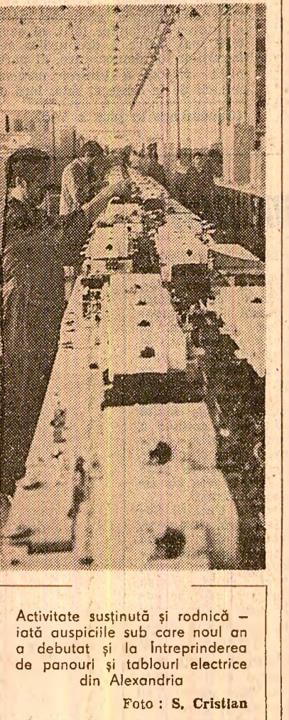
Activitate susținută și rodnică — iotă oscipulie sub care noul an a debutat și la întreprinderea de panouri și tablouri electrice din Alexandria

Fără a intra în detalii privind măsurile care trebuie adoptate în acest scop, pe fiecare șantier, trebuie să subliniem că disciplina în muncă înțelesă cu fermitate pe șantier, folosirea integrată a fondului de timp productiv, a utilajelor de construcție și a capacității lor maxime, a forței de muncă la un nivel de productivitate superior sînt imperative care trebuie să direcționeze în permanență munca constructorilor și montajului. Alături de aceste măsuri cu caracter organizatoric, un rol important îl are sporirea gradului de industrializare și mecanizare a lucrărilor, generalizarea tehnologiilor de execuție eficiente, a experientelor înaintate în muncă și a inițiativelor valoroase. Cu spiritul concret al organelor județene de partid, al organizațiilor de partid de pe șantier din unități beneficiare și furnizoare de utilaje, constructorii și montajul au obligația să acționeze cu responsabilitate, seriozitate și abnegație în muncă pentru intensificarea vitezei zilnice de lucru. Ne aflăm la începutul ultimului an din acest cincinal. Avem în fața noastră o perioadă de eforturi susținute, care urmează să se materializeze, pe șantier, prin munca dirijată a constructorilor și montajului, a celorlalți factori din investiții în punerea în funcțiune a tuturor noilor obiective și capacități prevăzute.