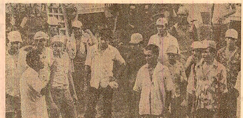
NICARAGUA. Pe fostele latitudini ale lui Somoza lanșează cooperative agricole. Noi proprietari — țevanii din regiunile agricole — au primit dreptul reformei agrare, care le pune la dispoziție îngrășămintele, mașinile agricole și specialiștii. În imagine: membrii primei cooperative agricole, înființată în urmă cu jumătate de an în apropiere de Leon, în timpul unei consfățiri de producție

Olesen a menționat că sesiunea Parlamentului danez, care a început luni, va trebui să examineze proiectul de lege privind înghetarea la nivelul actual de 2,7 miliarde mărci a cheltuielilor militare în perioada 1981—1984.