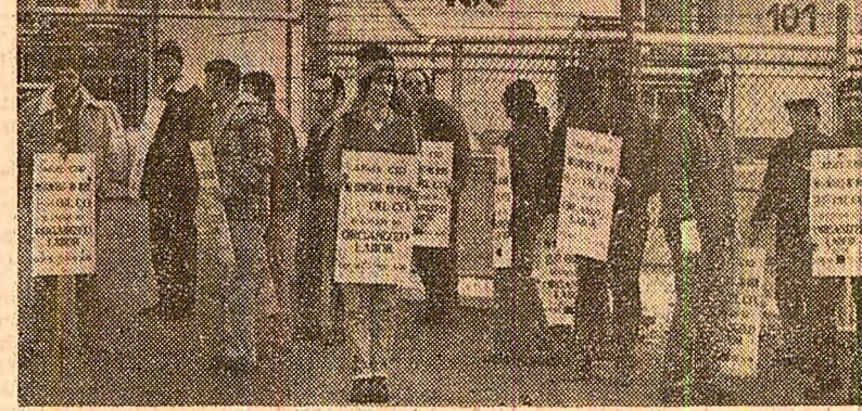
Recent s-a desfășurat în Statele Unite o amplă acțiune revendicativă care a antrenat zeci de mii de muncitori din întreprinderile de rafinare a șteiului. În fotografie — un pichet de greviști în fața rafinării din Marcus Hook, localitate din apropiere de Philadelphia.

ACCIDENT GRAV ÎN ORAȘUL COLUMBIAN SINCELEJO. Tribuna stadionului din orașul columbian Sincelajo, unde avea loc o luptă cu tauri, s-au prăbușit și peste 100 de persoane și-au pierdut viața, iar peste 700 au fost rănite; majoritatea grav. La locul tragediei au sosit echipe speciale de ajutor, autoritățile luând măsuri urgente pentru îngrijirea răniților și asigurarea medicamentelor necesare.