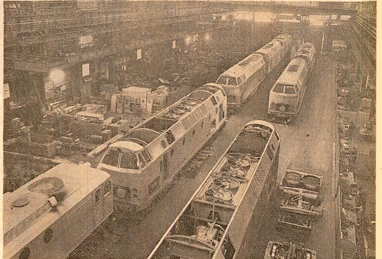
„23 August”, veche și puternică cetate muncitorească, marcă de prestigiu a industriei socialiste din România, a cunoscut în ultimii ani substanțiale creșteri ale volumului și calității producției