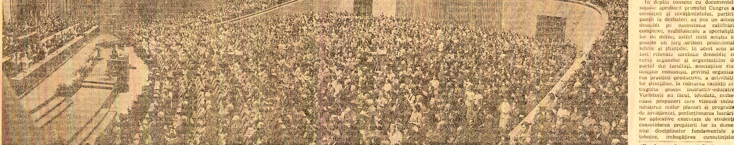
(Continuare în pag. a V-a)

Rezultate bune în întregerea învățământului cu cercetarea și producția s-au obținut și în alte domenii. Consiliul Național pentru Știință și Tehnologie, în colaborare cu Ministerul Educației și Învățământului, cu alte ministere și organe centrale, a spus în continuare vorbitorul, va elabora programe speciale în cadrul cărora, pornind de la cele mai avansate cerințe ale revoluției tehnico-științifice contemporane, să se asigure pregătirea rezervelor de descoperiri științifice și soluții tehnologice necesare dezvoltării în perspectivă a țării noastre până în anul 2000.