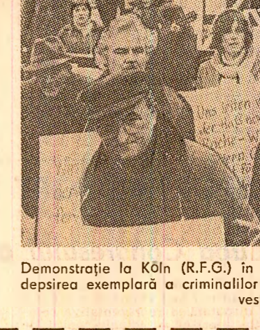
Demonstrație la Köln (R.F.G.) în cadrul căreia participanții au cerut pedepsirea exemplară a criminalilor nașiști, judecați în prezent de tribunale vest-germane

DIZOLVAREA UNOR PARLAMENTE LOCALE ÎN INDIA. Președintele Neelam Sanjiva Reddy a semnat un decret prin care sînt dizolvate parlamentele locale în nouă regiuni ale Indiei.