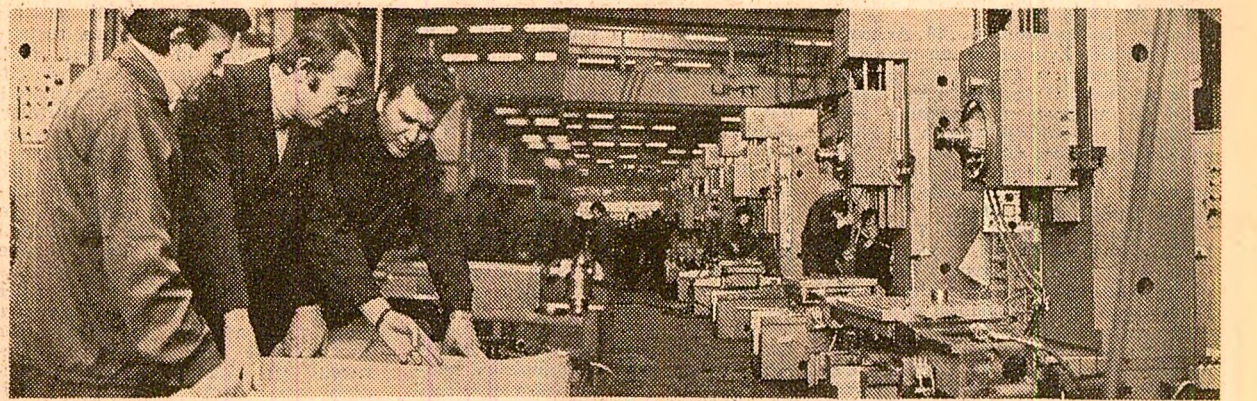
Întreprinderea „Înfrățirea”-Oradea. Într-o nouă hală de producție se montează utilajele