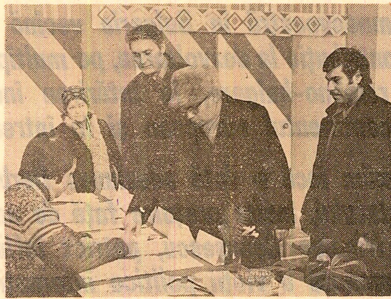
În întreaga ţară continuă acţiunea de verificare a înscrierii cetăţenilor în listele de alegători. Imagine surprinsă la Centrul de afişaj nr. 21 din cartierul bucureştean Colentina