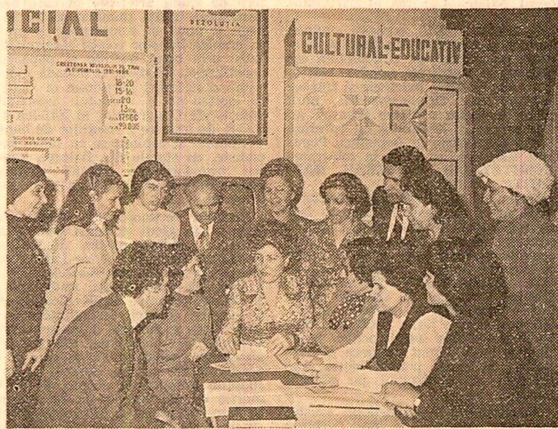
Aspect de la „Casa alegătorului” din cadrul circumscripţiei nr. 16 Armata Poporului din Bucureşti, a Marii Adunări Naţionale