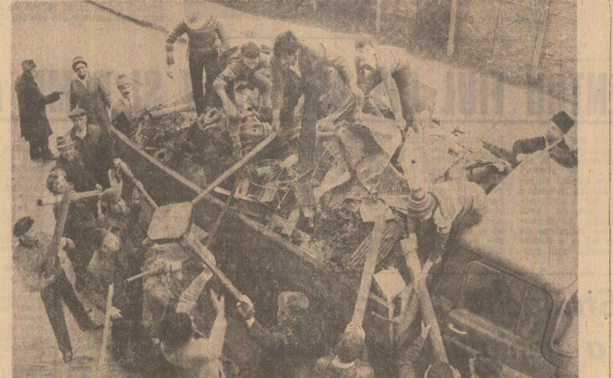
Locatarii blocului C din soseaua Giurgiului 58-70 au contribuit și la încărcarea autocamionului cu fierul vechi colectat de ei în timpul săptămîinii.