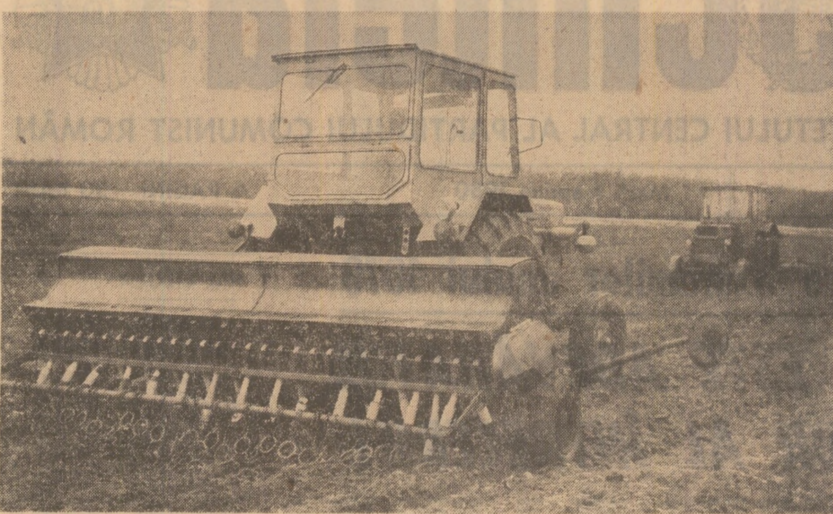
La cooperativa agricolă din comuna Nanov, județul Teleorman, semănatul culturilor din prima epocă este avansat.