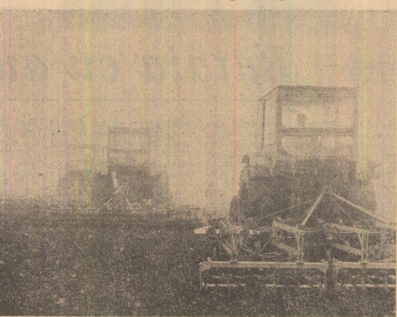
Spre cîntecul lor, cei 14 mecanizatori care lucrează pe terenurile C.A.P. Mihăilești-Buzău se aflau în plină activitate încă din zorii zilei, la pregătirea terenului și semănat