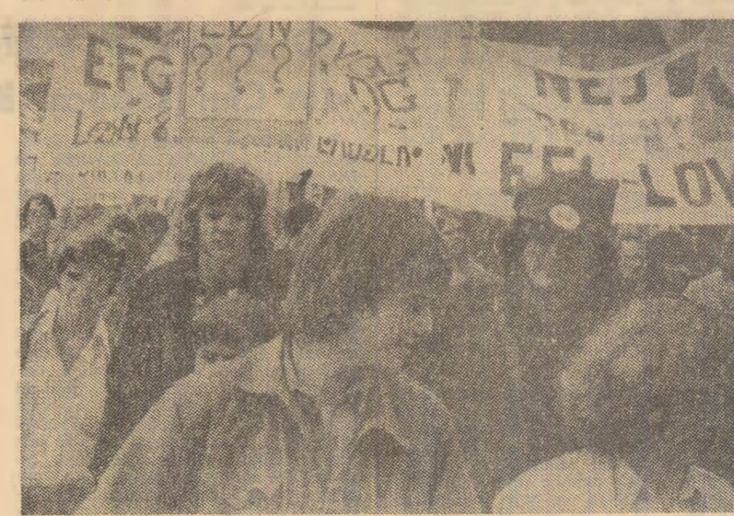
Tineri danezi manifestînd pentru asigurarea locurilor de muncă

nuate, de asemenea, experiențele tehnico-științifice, studiile asupra resurselor naturale ale Pământului, cercetările medico-biologice în spațiu cosmic. Starea celor doi cosmonauți după lansare este bună, iar aparatele de la bordul navei funcționează normal.