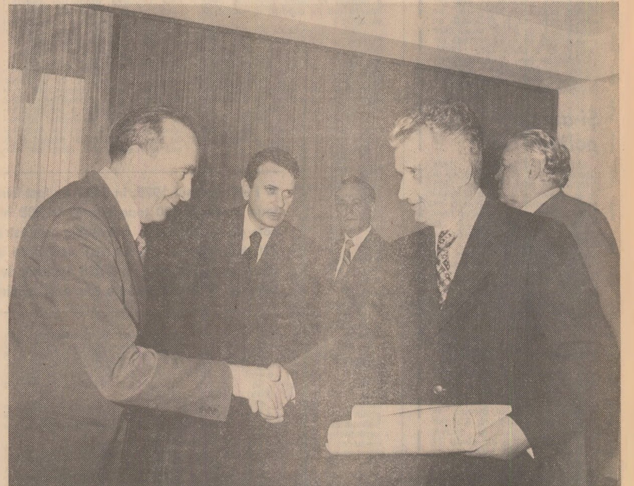
La solemnitatea înmînării înaltelor distincții