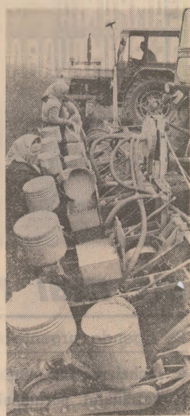
Cooperativa agricolă de producție „Scintei” din Poiana Mare-Dolj: print-o bună organizare a muncii au fost însemnate însemnate sub prefețe cu porumb