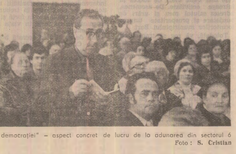
„Tribuna democrației” — aspect concret de lucru de la adunarea din sectorul 6

cețetănească, un for care aduce la lumină preocupări, idei, soluții care interesează pe fiecare om și obste în interesul ei. De la problemele lumii la problemele cartierului, astfel ar putea fi caracterizată dimensiunea preocupărilor celor prezenți. asa cum rezulță ea din întrebări: „Care este stadiul pregătirii Conferinței de la Madrid pentru securitatea europeană?” „Se pot face lucrări de termoficare și de străzile laterale, cu imobil fără etaj?” Pentru muncitorii care lucrează de mulți ani în București și nu și locuiește, dar conform legii, nu au dreptul la buletin de Capitală, ce soluții s-ar putea găsi pentru viitor?” „Statutul asociațiilor de locatari este obligatoriu? Face parte din normele stabilite prin lege?” „Se va construi o centrală atomoelectrică în București?” „Dimbovitva va fi un riu curat, care să ne împodobească orașul?” Trănscriind aceste întrebări și răspunsurile sentimentul pe care l-am avut ascultîndu-le: ne aflăm nu într-o adunare cețetănească de sector (respectiv dintr-o întreprindere), ci într-o agora. Și, repetăm, de fapt așa și este. „Tribuna democrației” se anunță să devină un larg forum cețetănesc.