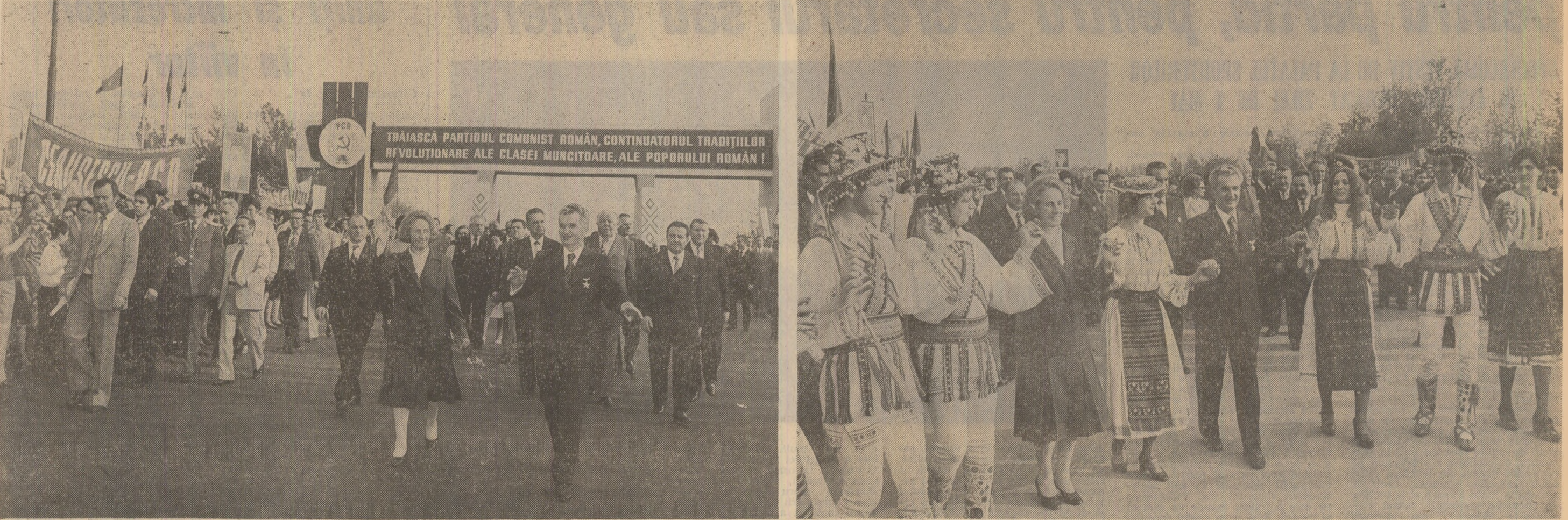
Din lumina zilei de mai, lumina dragostei și înaltei prețurii pentru tovarășul Nicolae Ceaușescu și tovarășa Elena Ceaușescu