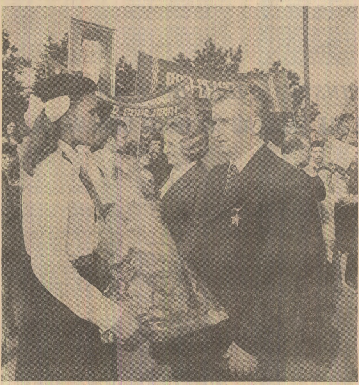
Flori de recunoștință pentru conducătorul lăbit