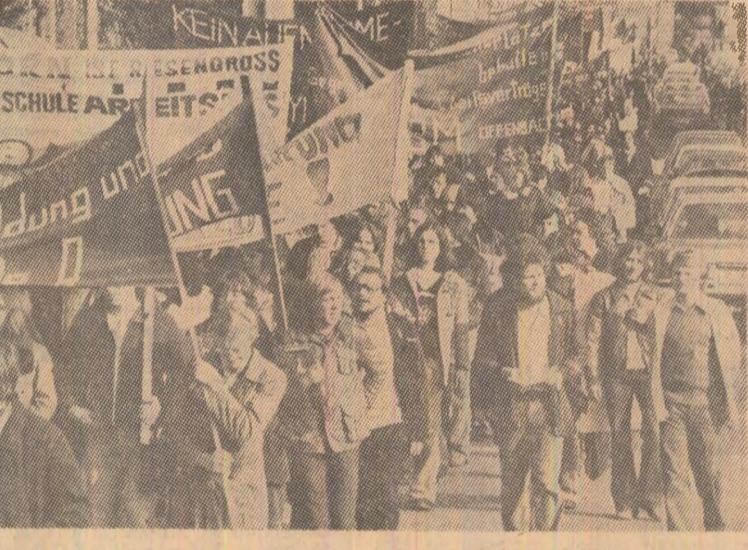
Demonstrație a tineretului vest-german sub lozincă: „Vrem ca școlile să nu mai fie uzine de șomeri“