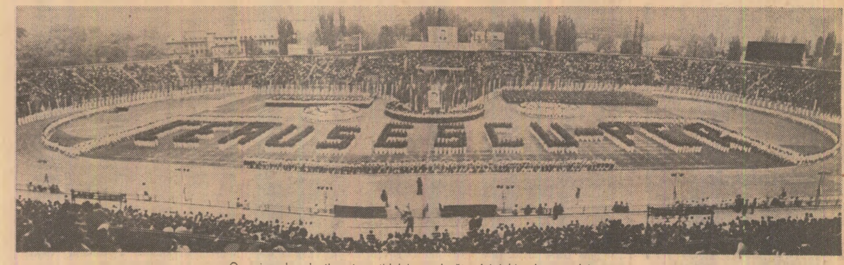
Omagiu adus de tineret partidului, conducătorului iubit al poporului nostru

Dumitru SIMULESCU membru de partid cu stagiu din ilegalitate (Continuare în pag. a II-a)