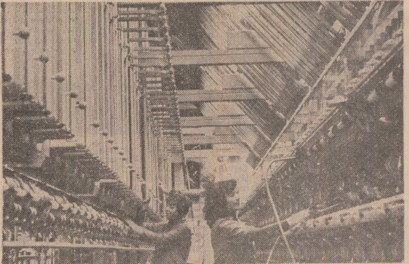
Pe șantierul Combinatului de fire sintetice din Vaslui, în preajma punerii în funcțiune selecționează susținut pentru terminarea tuturor lucrărilor (fotografia din stînga). În secția etirare-texturare, utilajele sînt pregătite pentru începerea probelor tehnologice (fotografia din dreapta)