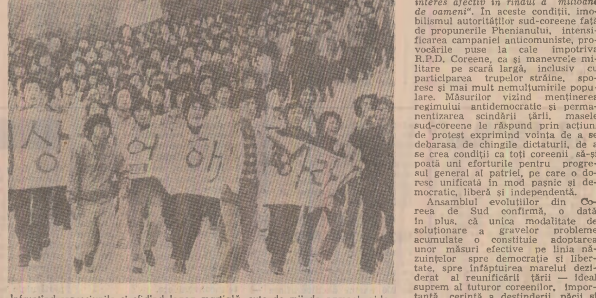
Într-unul din momentele de discuție în cadrul ședinței Comisiei militare de armistițiu din Coreea, la Panmunjon.

PANMUNJON 20 (Agerpres). — La propunerea reprezentanților R.P.D. Coreene în Comisia militară de armistițiu din Coreea, la Panmunjon a avut loc marți a 40-a ședință a comisiei, în cadrul căreia reprezentanții au formulat un protest ferm față de provocările militare comise recent de partea adversă în zona comună de securitate. Totodată, au fost dezavuate tentativele părții opuse de a aduce acuzații nefondate R.P.D.C. și au fost condaminate provocările militare sud-coreene din zona demilitarizată — relatează agenția A.C.T.C. De asemenea, conducătorul părții reprezentînd R.P.D.C. în Comisia militară de armistițiu, generalul-maior Han Ju Gyoung, a trimis o scrisoare țării neutre pentru supravegherea armistițiului din Coreea o scrisoare, în care relevă gravitatea unor asemenea provocări și imperativul de a nu se permite repetarea lor în viitor.