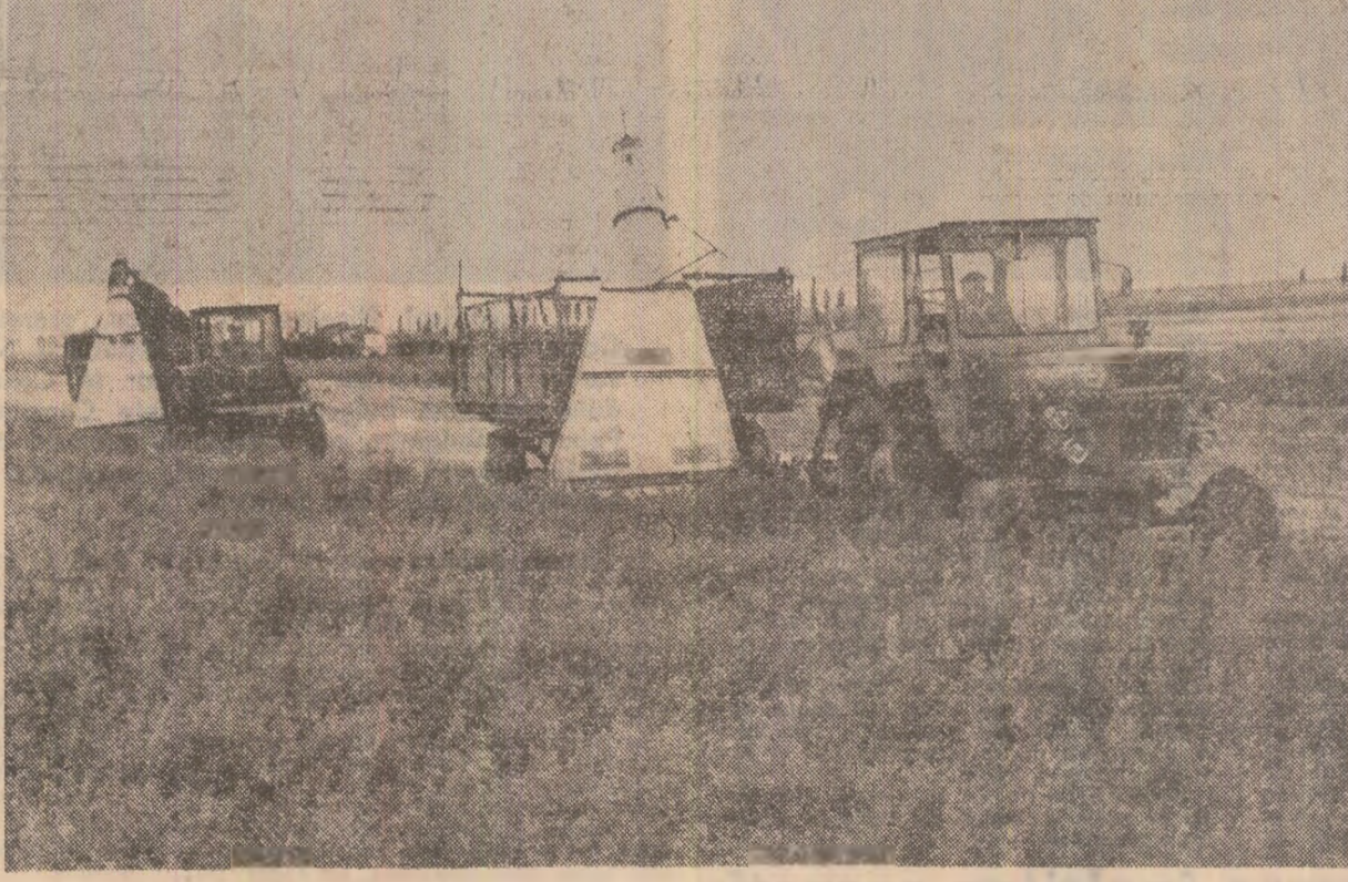
leri, la C.A.P. Costești, județul Buzău, se lucra din plin la recoltarea lucernei

Iată cum se prezintă situația în unitățile din consiliul agroindustrial Strîmb. După ce au fost constituite trei formații de mecanizatori, ele au început să fie dispărute, lesinînd de