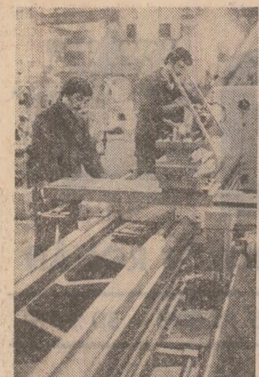
Aspect din sala de montaj a întreprinderii de strunguri „SARO”, din Tîrgoviște