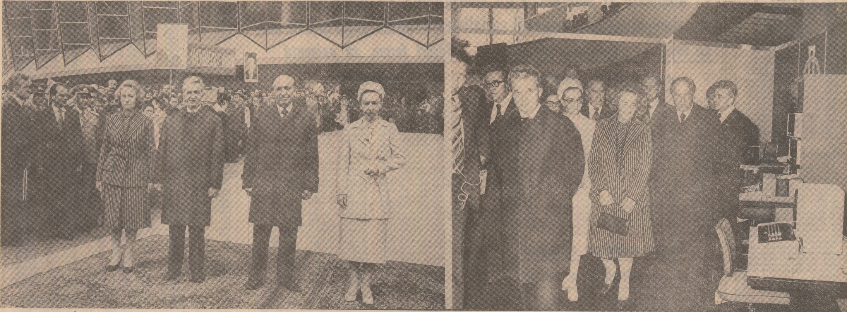
Momente de la inaugurarea Expoziției industriale bulgare