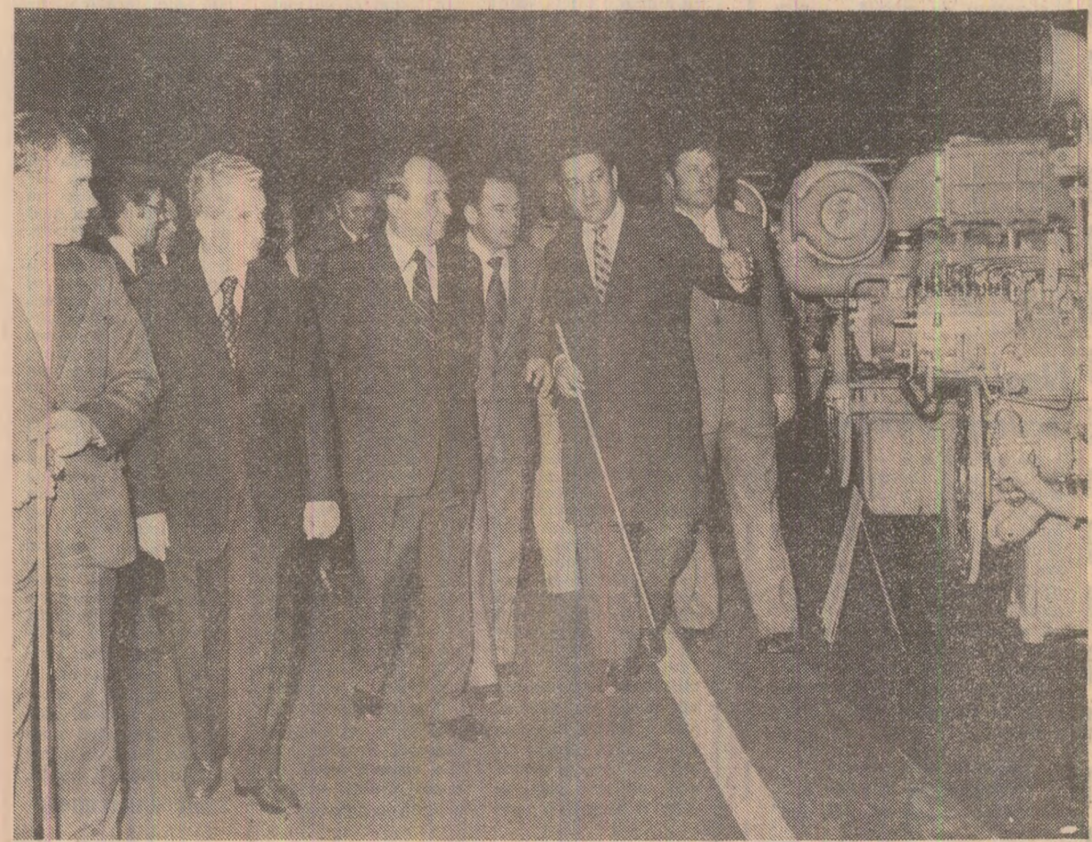
În timpul vizitei la întreprinderea „23 August”, din Capitală