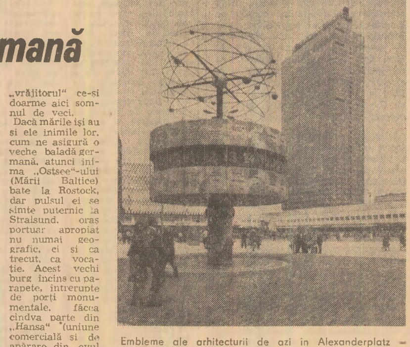
Embleme ale arhitecturii de azi în Alexanderplatz — loc de promenadă predilect al berlinezilor