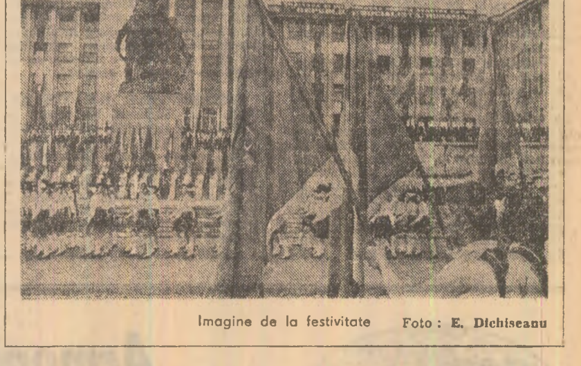
Imagine de la festivitate