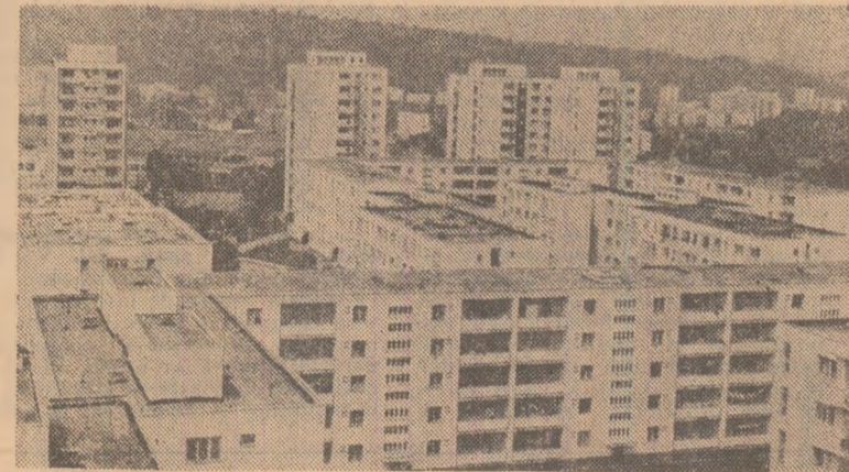
Cluj. Vedere din cortierul Mănoștur

A fost dat în folosință cel de-al 27 500-lea apartament. Aceasta marchează îndeplinirea de către colectivul de oameni ai muncii români, maghiari și de alte naționalități al Trustului de construcții Cluj, a prevederilor planului cincinial la acest important capitol, defăpturii pentru ridicarea continuă a nivelului de trai. Succesul permite constructorilor clujești să realizeze pînă la finele anului 35 000 de apartamente, deci 7 500 apartamente peste preveder-