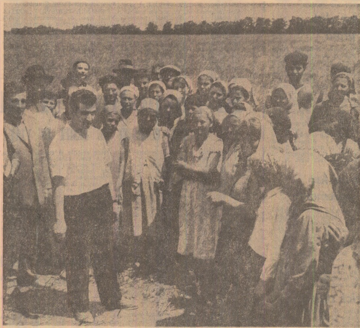
26 iunie 1965. Tovarășul Nicolae Ceaușescu în mijlocul țărănilor cooperatori din comuna Gheorghe Doja, județul Ialomița, cu prilejul primei sale vizite de lucru în calitate de conducător al partidului

bărbați și femei, cu bătrîni și tineri, într-un cuvînt cu întregul popor în alegerea celui mai bun drum spre țelurile pe care le avem de îndeplinit”.