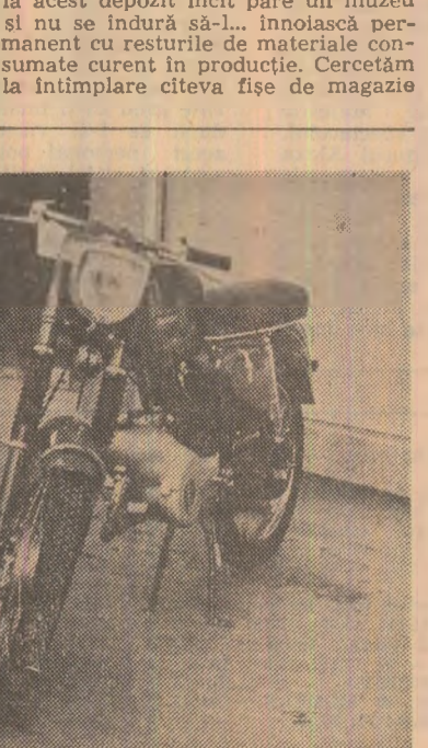
Dumitru TIRCOB Ilie ȘTEFAN

Prin magazinele de specialitate puteți cumpăra motocicletă MOBRA SUPER și motocicletă MINI MOBRA, într-o gamă variată de culori. MOBRA SUPER transportă două persoane, este un mijloc rapid, atînge viteza maximă de 60 km/oră și are un consum de benzină de 2,5 litri la suta de km. MINI MOBRA atînge o viteză de 40 km/oră, consumă 1,8 litri benzină la suta de km și poate fi folosită și ca bicicletă. Pe distanța de 100 km, transportul cu MOBRA SUPER costă numai 17 lei, iar cu MINI MOBRA - 12 lei. MOBRA SUPER și MINI MOBRA pot fi cumpărate atît cu plata integrală de 7.800 lei și respectiv - 4.900 lei, cît și în rate lunare, cu un avans de 30%.