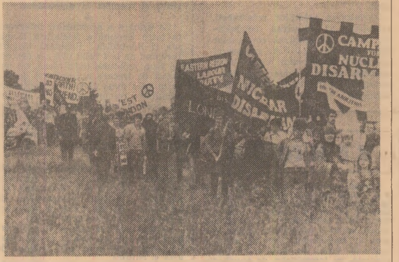
Peste 1000 de persoane au manifestat duminică în apropierea bazei aeriene dezafectate de la Molesworth, la 100 km nord de Londra, protestînd împotriva amplasării în Marea Britanie a 160 rachete de croazieră americane. Demonstrații purtau pancarte care cereau interzicerea armelor nucleare