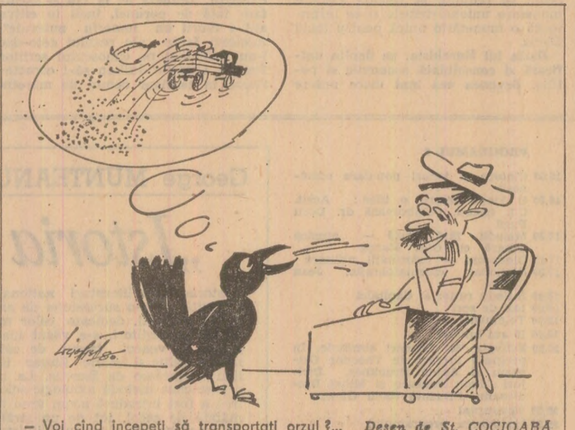
— Voi cînd începeți să transportați orzii?... Desen de St. COCIOABA