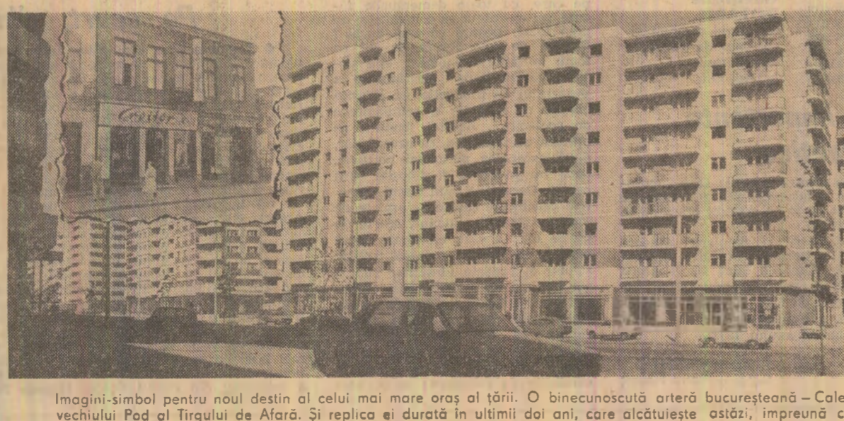
Imagini-simbol pentru noul destin al celui mai mare oraș al țării. O binecunoscută artă bucureșteană — Calea Moșilor. Așa cum o puteam vedea pînă mai ieri, la scara măruntelor prăvălii și dughene inghesuite de-a lungul vechiului Pod al Tîrgului de Afară. Și replica ei durată în ultimii doi ani, care alcătuiește astăzi, împreună cu noua Colentina, o impunătoare magistrală, demnă de lumina civilizației socialiste

Îndeplinirea sarcinilor de livrare trebuie să se preocupe îndeaproape consiliile de conducere și organizațiile de partid din fiecare cooperativă agricolă, acestea constituînd o obligație fundamentală, o înaltă îndatorire patriotică. Încît atât de important este să se strîngă și să se transporte mai repede palele din cîmp la locurile de depozitare a furajelor. Subliniem această întrucît, în nu oputine locuri s-au creat decalaje mari între suprafețele recoltate și cele eliberate de paie. Aceasta explică în bună măsură de ce pînă la 20 iulie au fost însumate numai 697.500 hectare — adică 49 la sută din suprafața destinată culturilor duble.