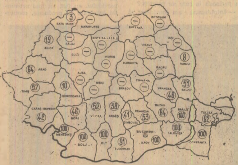
Stadiul recoltării grîului la 20 iulie

Recoltarea grîului se desfășoară intens în cea mai mare parte a țării. Față de datele furnizate de Ministerul Agriculturii și Industriei Alimentare, până în seara zilei de 20 iulie grîul a fost strins de pe 1.137.500 hectare — 51 la sută din suprafața cultivată. După județele Ialomița, Brăila, Constanța și Ilfov, ieri au anunțat încheierea recoltării grîului și județele Dolj, Mehedinți și Olț. Sînt rezultate care demonstrează că, acționînd în spiritul indicațiilor tovarășului Nicolae Ceaușescu de a strînge grîul cu timp scurt și fără pierdere, oamenii muncii din agricultură acestor județe, cu sprijinul organelor de partid și agricole, au folosit din plin combinatele și celelalte utilaje, reușind astfel să desfășoare cea mai scurtă campanie de recoltare.