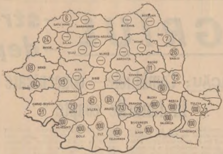
Stadiul recoltării grîului la 25 iulie

Desigur, pe importante suprafețe de teren continuă să bălăcescă apele. De aceea, se impune să se acționeze cu hotărîre în vederea evacuării lor, astfel încît combine-