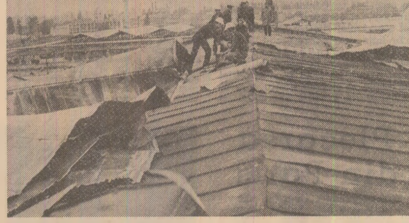
Acoperișurile caselor și ale unităților economice din Arad, afectate de furtună, sînt repede refăcute