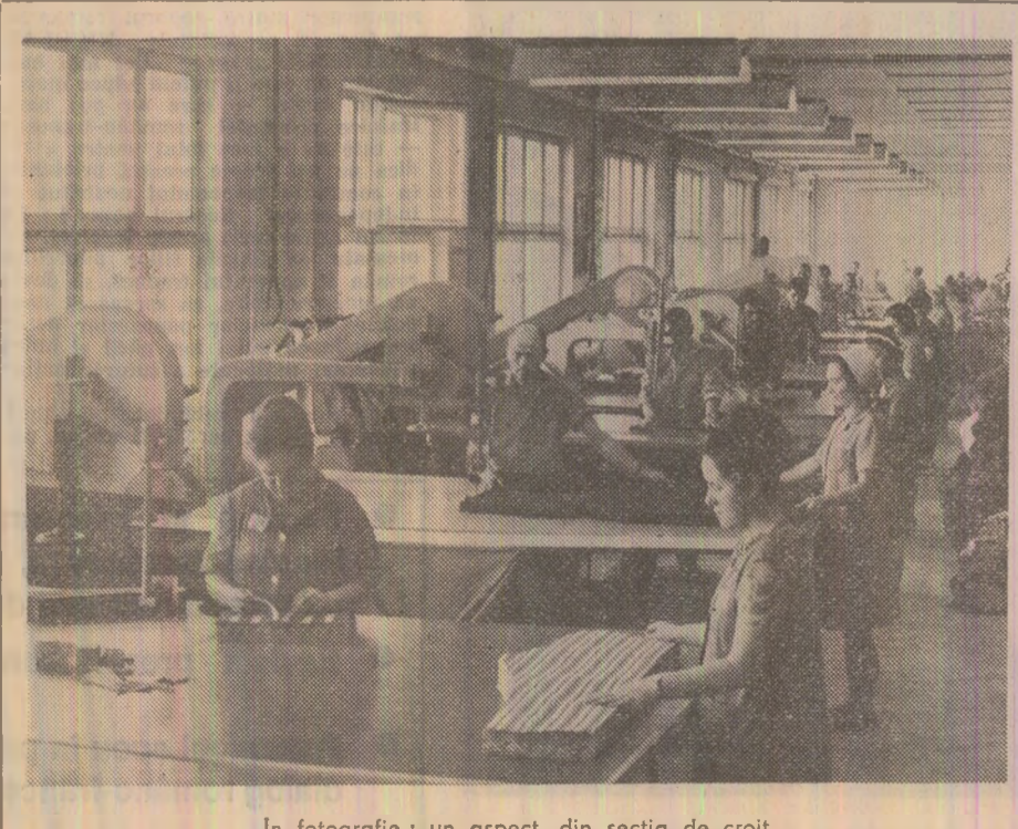
În fotografie: un aspect din secția de croit

Gheorghe GIURGIU corespondentul „Scintei”