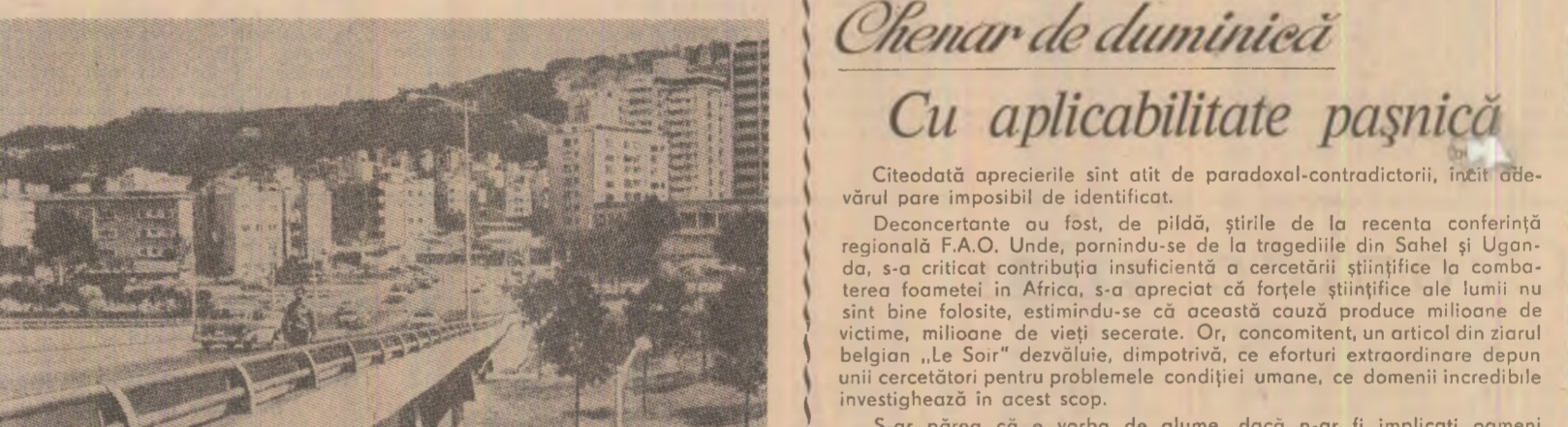
Cutezanțe urbanistice la Caracas

Încheierea principalilor teme ale agendei convorbirilor dintre cei doi președinți: colaborarea dintre cele două țări pe plan economic și problemele situației internaționale actuale.