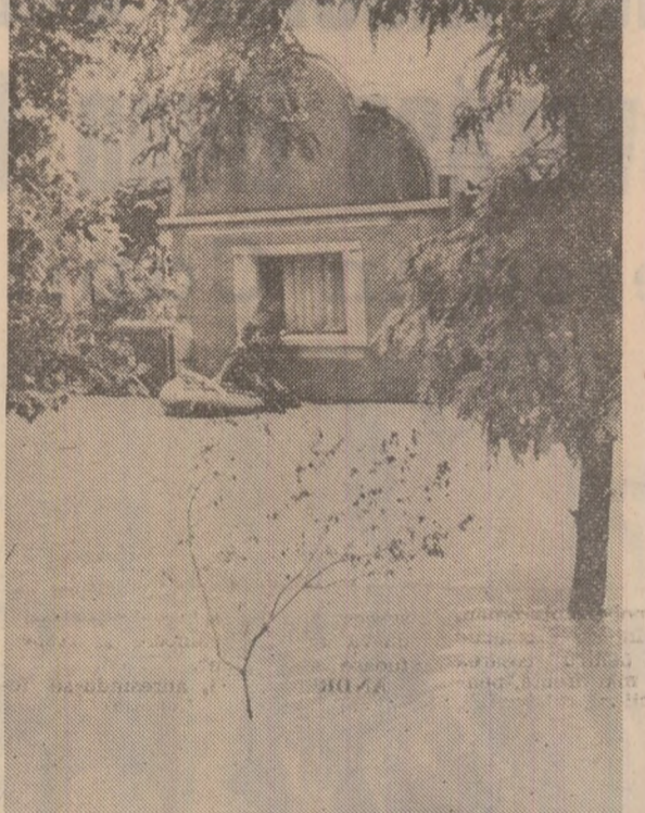
Satul Tăut, județul Bihor, greu încercat de revărsarea apelor