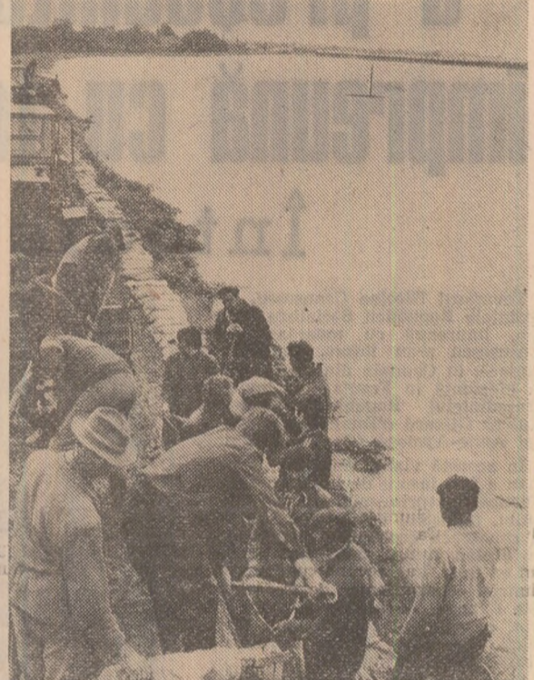
La Zerind, județul Arad, sute de oameni lucrează la întărirea digului pe Crisul Negru