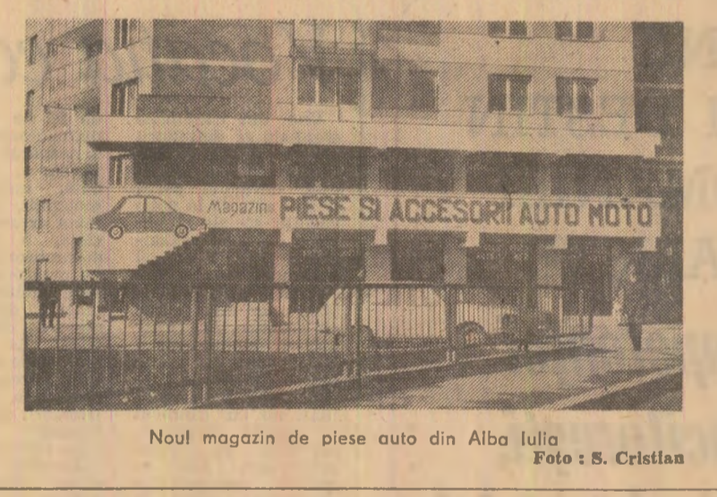
Noul magazin de piese auto din Alba Iulia

hoale pentru copii, iar în cartierul Ampol din Alba Iulia o unitate de legume și fructe. De menționat și un nou magazin în cartierul Ampol din Alba Iulia, o unitate de legume și fructe.