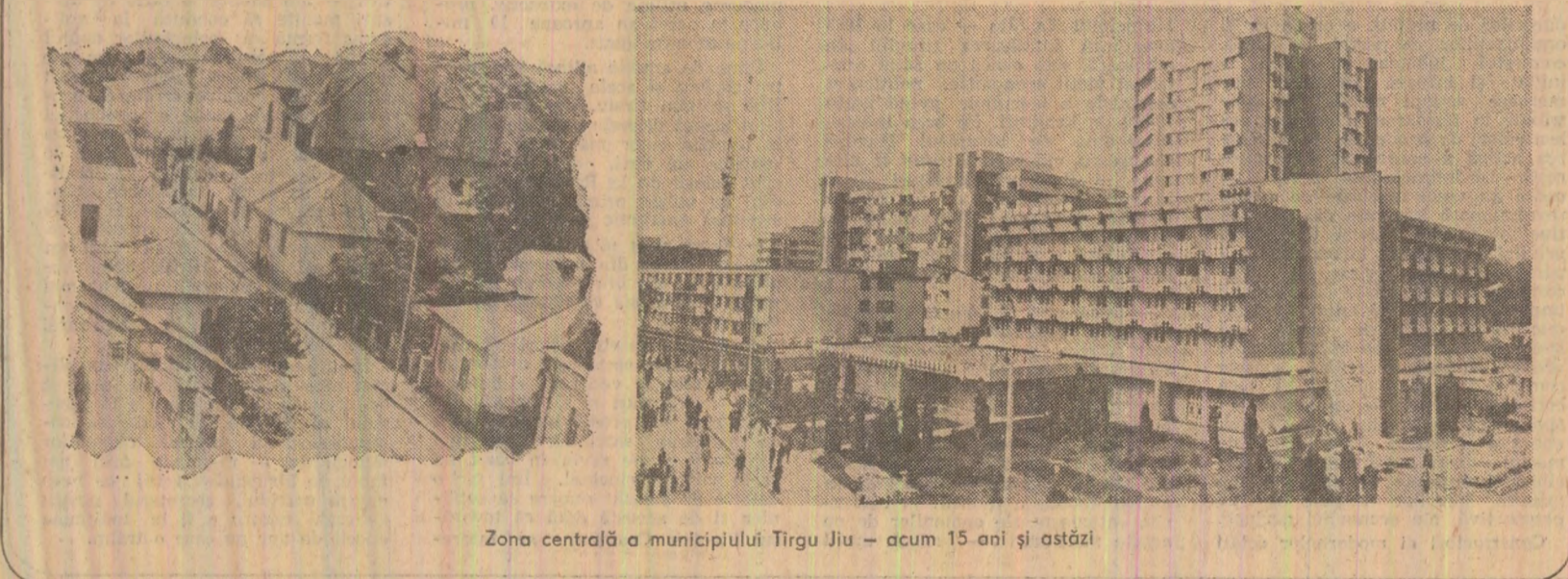
Zona centrală a municipiului Tirgu Jiu — acum 15 ani și astăzi