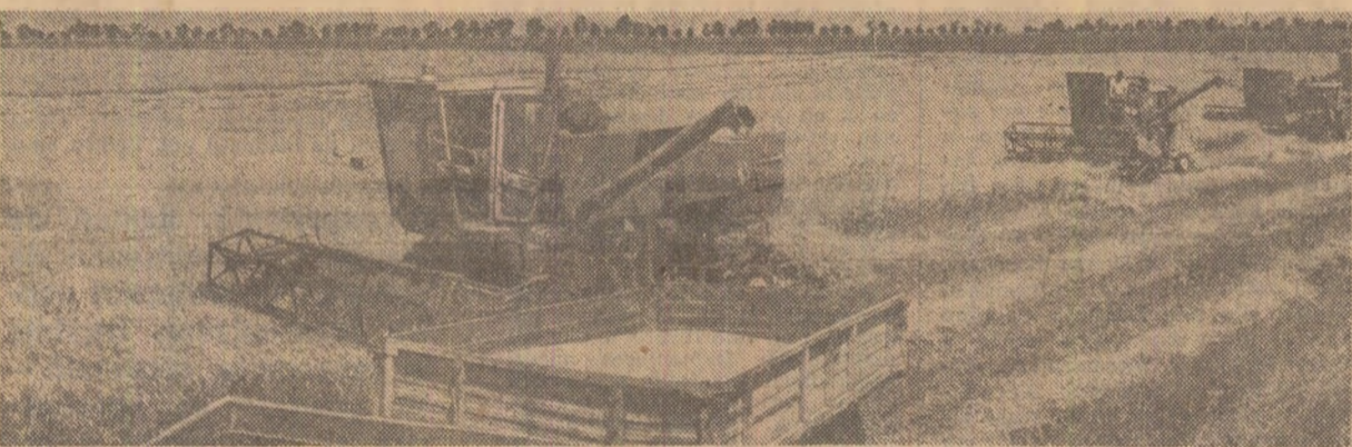
În multe unități agricole din județul Bihor, secerișul grîului se desfășoară cu toate forțele