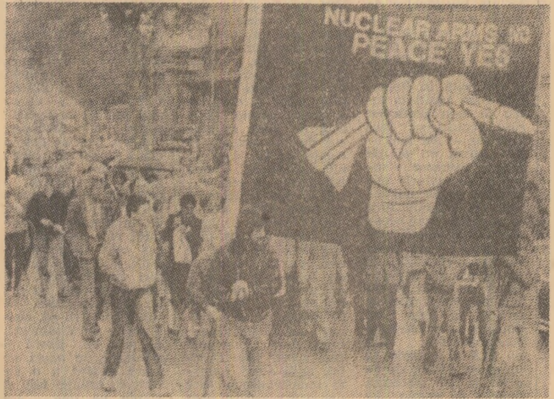
Demonstrație la Londra împotriva amplasării de rachete nucleare cu rază medie de acțiune pe teritoriul Marii Britanii

La 11,02, ora locală, exact la aceeași oră la care s-a căzut asupra orașului bomba ucigătoare, au sunat toate sirenele și au bătat clopotele tuturor bisericilor, în semn de omagiu adus victimelor bombardamentului. Cel