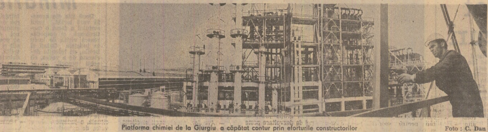
Platforma chimiei de la Giurgiu, a căpătat contur prin eforturile constructorilor.