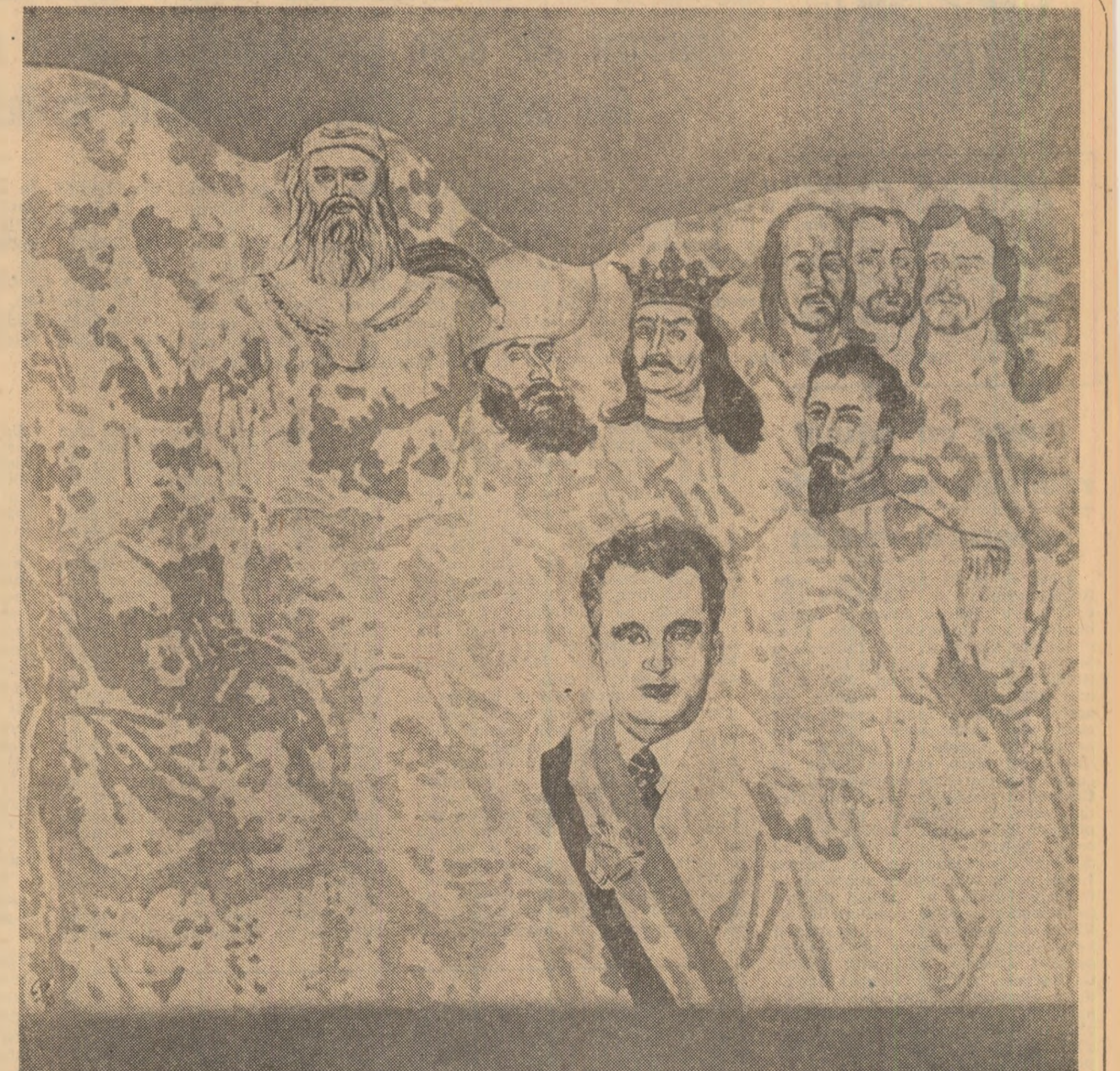
INSCRIPTII PE DRAPEL

Desigur că a dispărut orice temel real al unei cunoscute metafizice adoveniene, a „apel mortilor” sau a „locul in care nu s-a întimplat nimic”, aplicată multor localități rămasă in urma timpului a lumii, unele chiar in anii de după eliberare, pînă la istoricul Congres al IX-lea al partidului, care a proiectat noua lor arhitectură economică, socială și dialectică, spirituală — pînă la adoptarea, acum 15