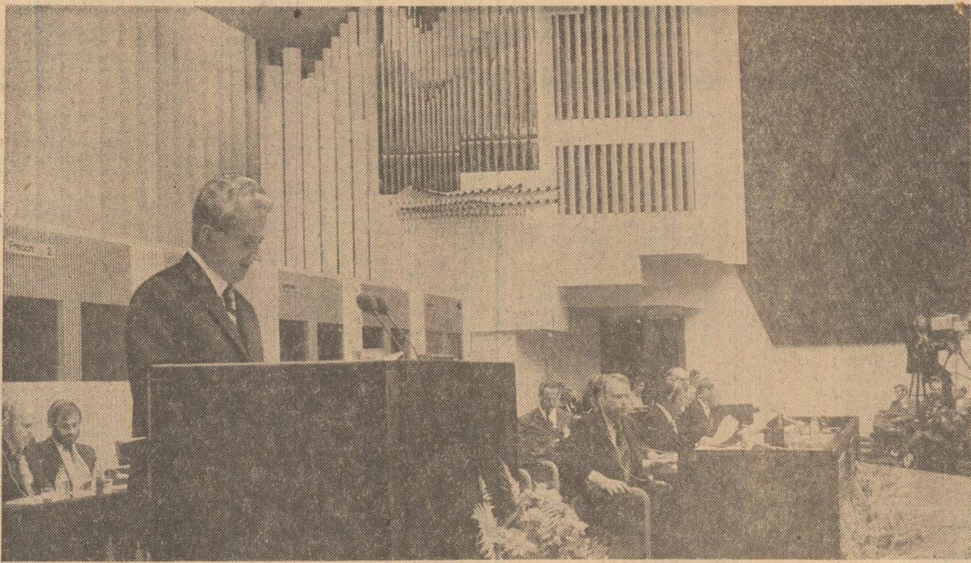
Cuvintul României, la tribuna istoricei Conferinţe pentru securitate şi cooperare în Europa

Piatră de hotar în istoria patriei, gloriosul act de la 23 August a deschis nu numai o eră nouă în destinele poporului român, dar a marcat, totodată, şi începutul unei coitari radicale în poziţia internaţională a României, a constituit punctul de plecare al unei politici externe de a deschide şi un dinamism fără precedent, în consens cu aspiraţiile vitale ale naţiunii, cu cerinţele generale ale măreţei cauze a păcii, democraţiei şi progresului pe întreg globul.