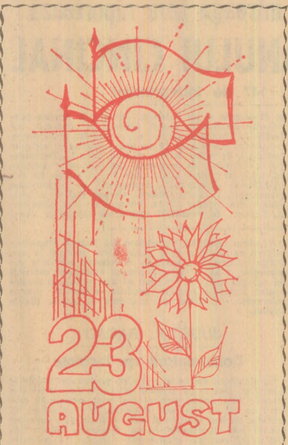
Desen de Gheorghe CALARASU