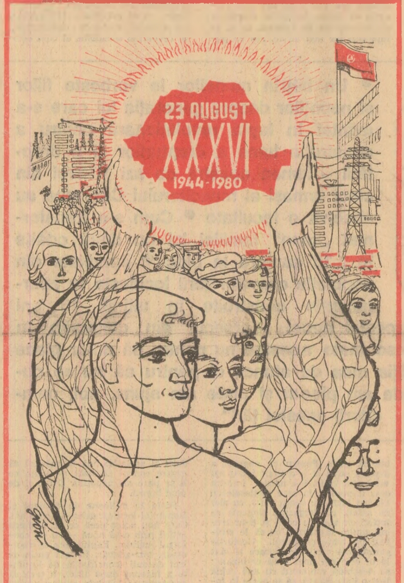
Desen de Mihail GION

Timp nou al țării și mindria ei De a trăi un vis biruitor Iși are-n August douăzeci și trei Pas de hotar spre falnic viitor! Partid-Popor! Sublimă unitate Prin care-n August țara își privește Dreptul la timp, la suveranitate, La gîndul spus curat, pe românește! AI. GH. SAVU (Continuare în pag. a V-a)