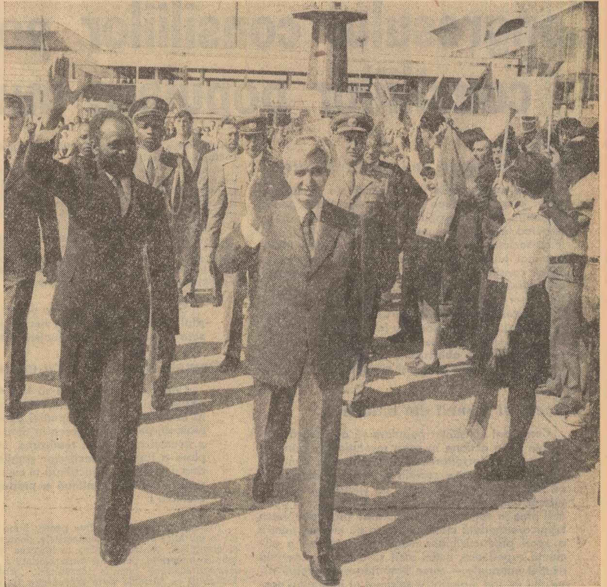
La sosire, pe aeroportul Otopeni