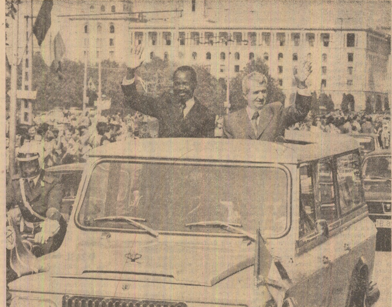
Tovarășii Nicolae Ceaușescu și Samora Moises Machel sint salutați cu prietenie și cordialitate de mii de locuitori ai Capitalei

Convorbirile se desfășoară într-o atmosferă de căldură prietenie, de simțată și înțelgere reciprocă.