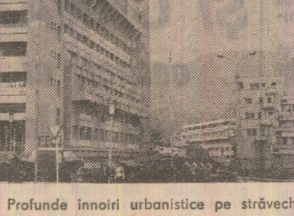
PIATRA NEAMȚ: Profunde înnoiri urbanistice pe străvechi meaeaguri

Dacă Săvineștii și Bozovul de acum un sfert de veac erau două sate megieșe ale Pietrel Neamț, de unde femeile descuțeau unii și unii „tîrzi”, în trăști, boțuri de brînză de vacă, ori cite un pui de găină „să-și desce pe gaz, să-și chibruț”, azi aceste așezări sînt centrele unei industrii chimice de prim rang, cucerite în două țări din lume. Și cite, multe și nenumărate înfăptuiri, și-iar merita locul în aceste însemnări!