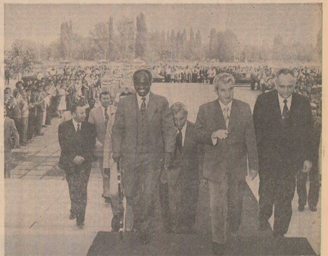
Imagini din timpul vizitei la Institutul politehnic București