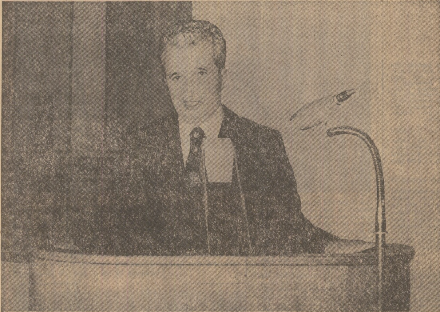
Tovarușul Nicolae Ceaușescu vorbind la parlament