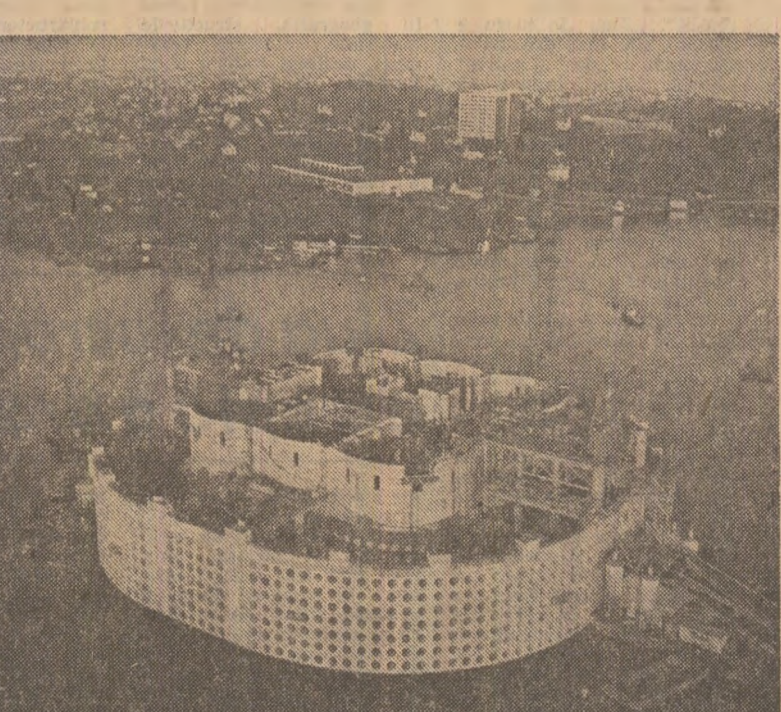
Pe platoul continental al Mării Nordului, în Norvegia, platformele de foraj marin au intrat în peisaj precum celebrele fiorduri

existență, dar care nu este în legătură cu petrolul, ar putea ieși din zona de interes și stăgna sau dispărea, și de aici eventualele perturbări pe care le aruncă în viața noastră socială... Sperăm să dezvoltăm o industrie bazată pe petrol. Din veniturile pe petrol putem dezvolta alte industrii. Avem deja un început în industria petrochimică. Am construit și o rafinărie pe coasta de vest, discutăm despre folosirea gazului metan în industriile de pe coasta vestică. De aceste probleme se ocupă acum intens ministerele noastre...”