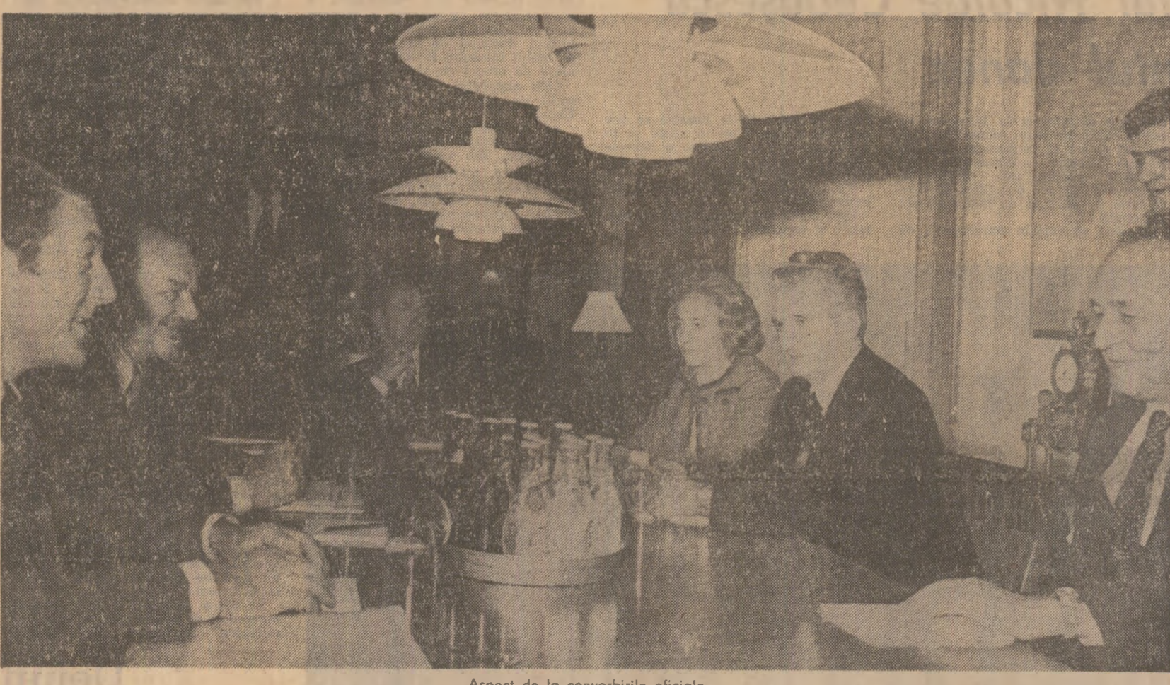
Aspect de la convorbirile oficiale