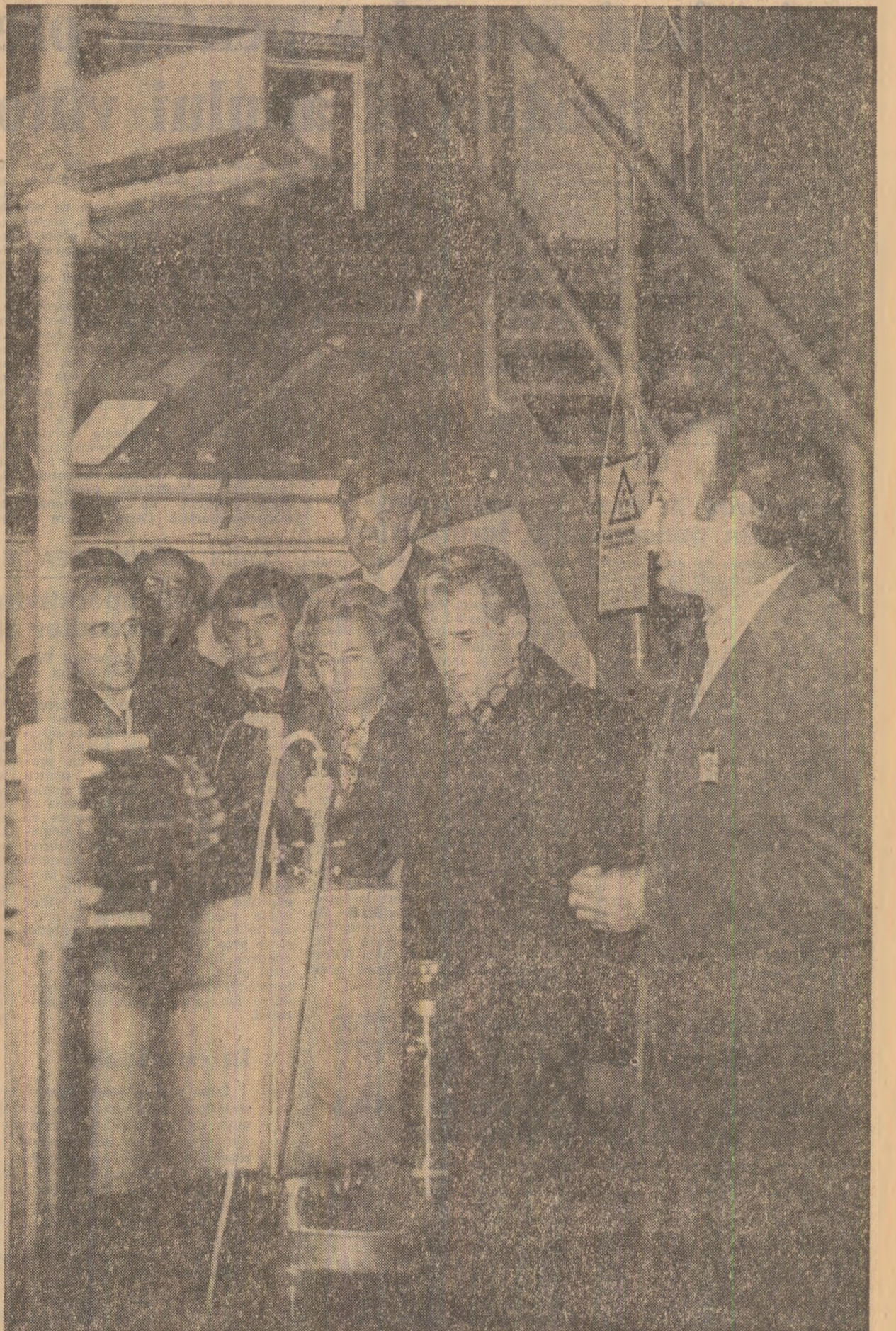
În mijlocul cercetărilor de la Risø