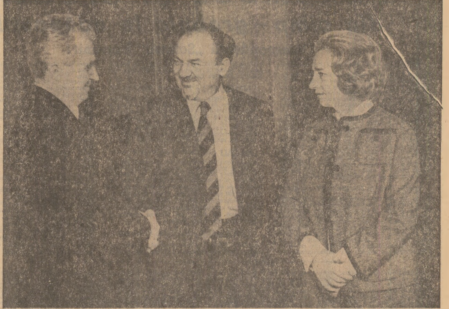
Înălții oaspeți se întrețin cu primul ministru danez