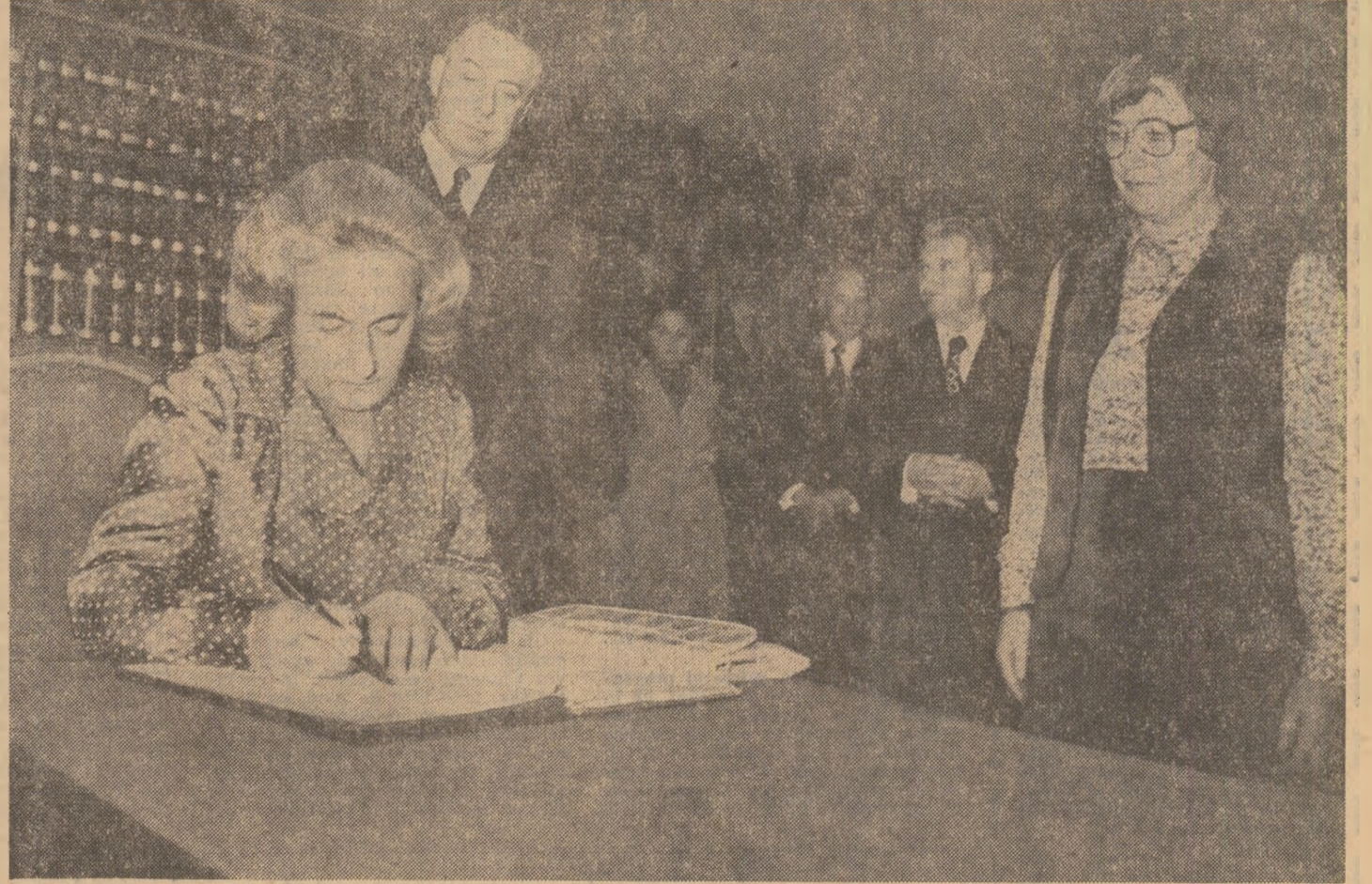
La festivitatea de la primăria orașului Copenhaga, semnind în Cartea de onoare