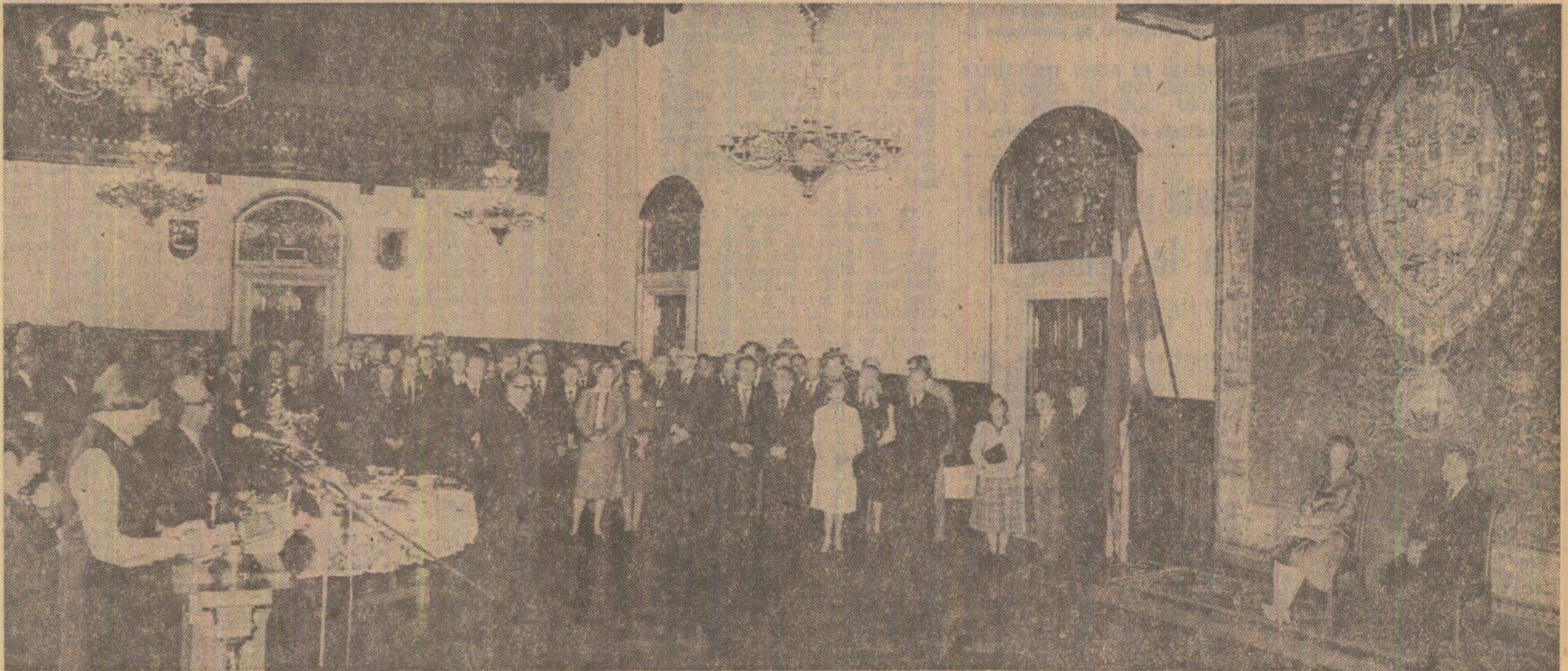
Caldă primire la primăria din Copenhaga

La Combinatul de fire sintetice Vaslui a intrat în circuitul productiv o nouă capacitate pentru fabricarea anuală a 900 tone fire polyesterice textile normale răscute, realizare care se înscrie în programul de finalizare a investițiilor din trimestrul IV al.c. Majoritatea utilajelor din procesul tehnologic reprezintă creații ale tehnicii românești furnizate de Centrula Industrială de fire și fibre chimice Săvinești. Combinatul de fire sintetice Iași și întreprinderea „Unitrea” din Cluj-Napoca. (Crăciun Lăluț).