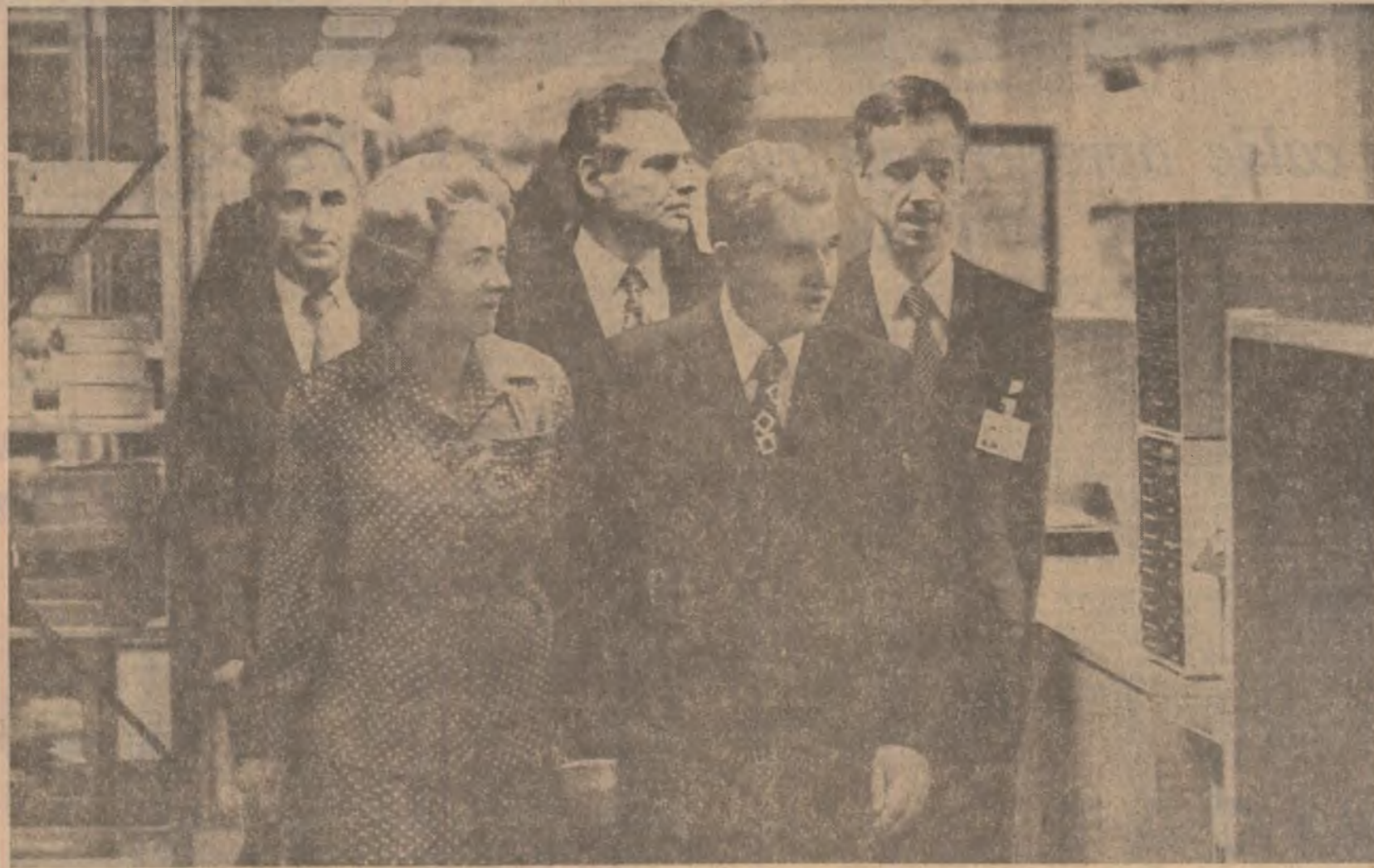
La renumita firmă industrială daneză DISA

În legătură cu rezultatele vizitei și convorbirilor purtate a fost adoptat un comunicat care se dă publicității.