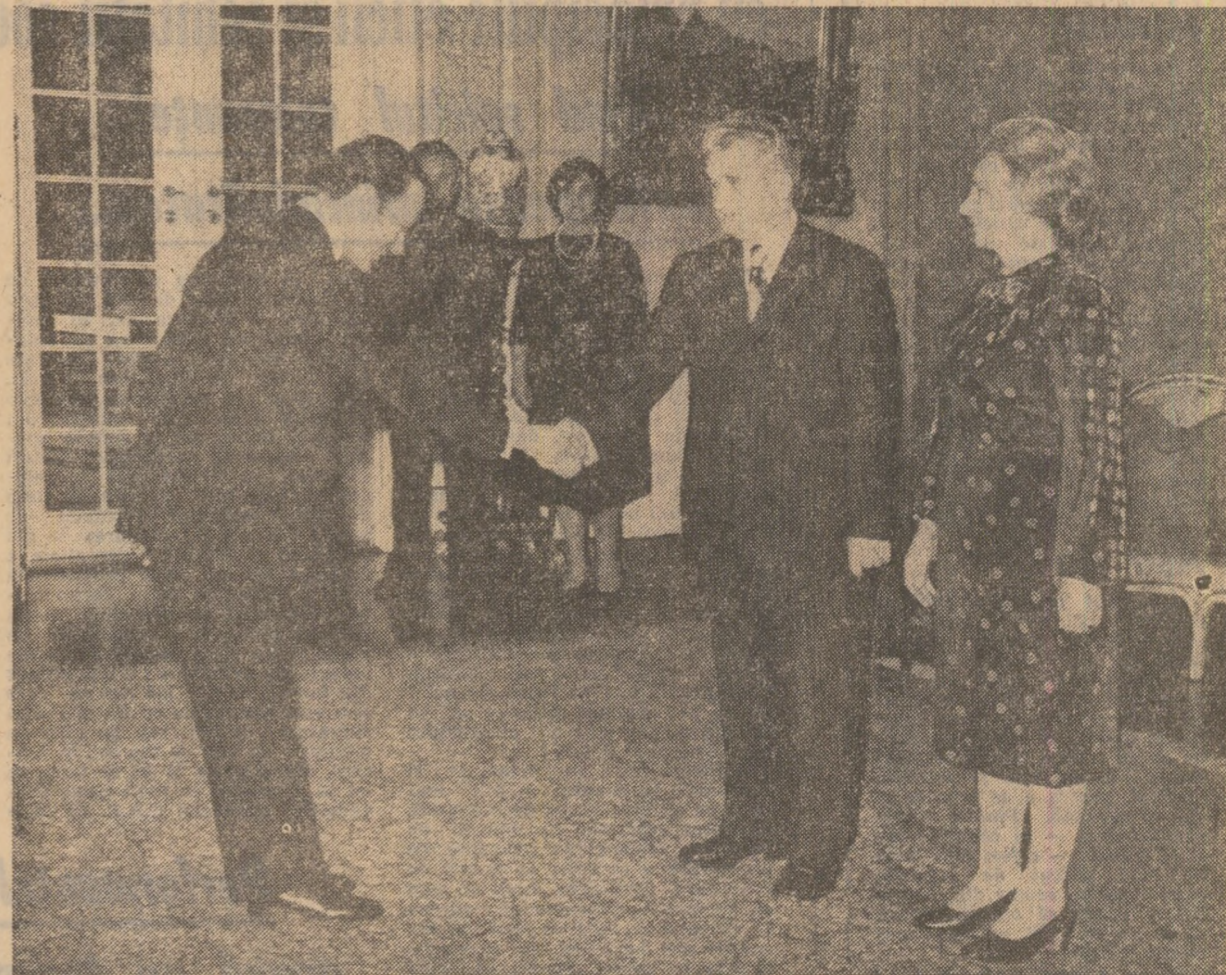
În timpul primirii șefilor misiunilor diplomatice