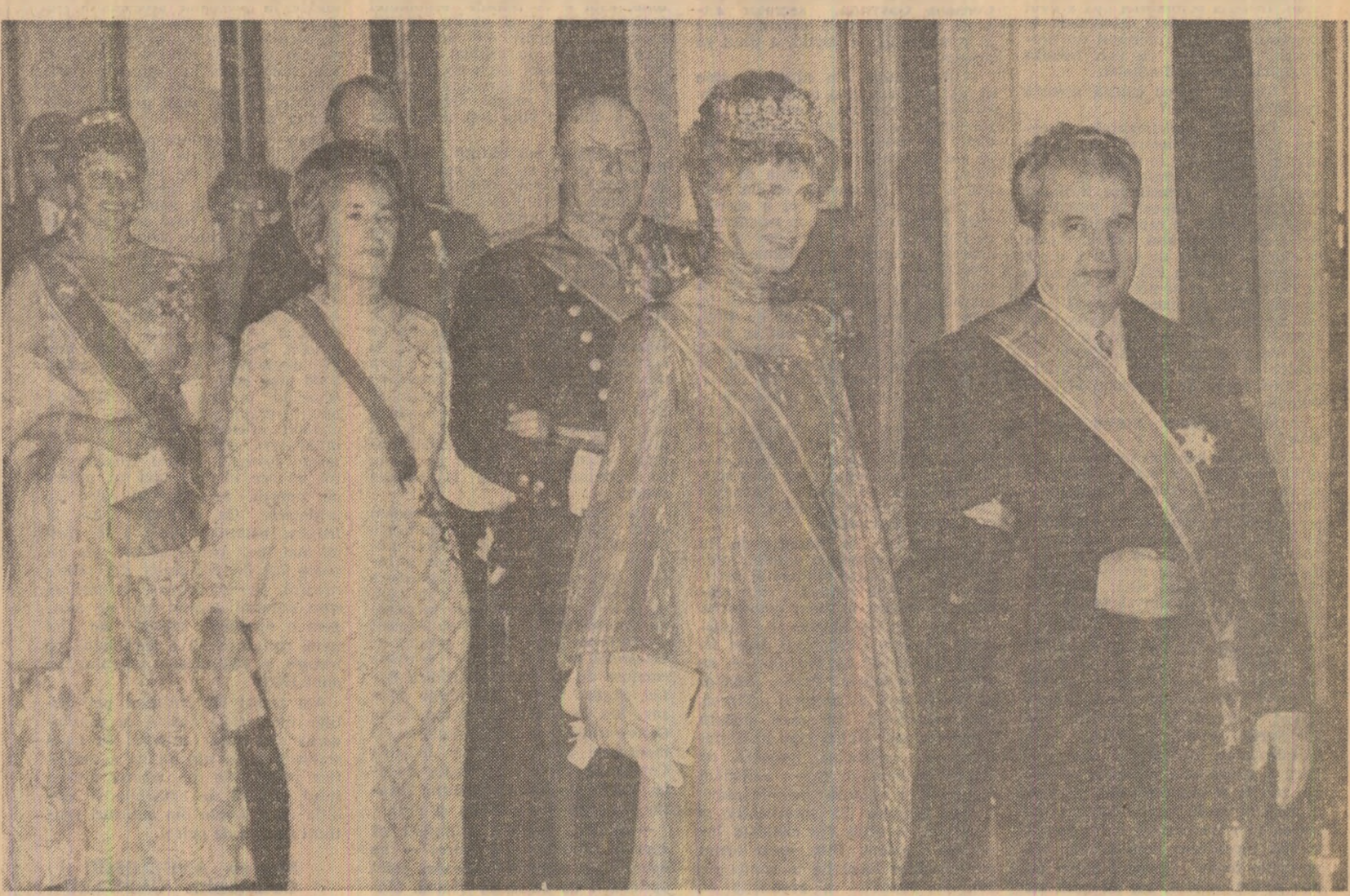
La dineul oficial