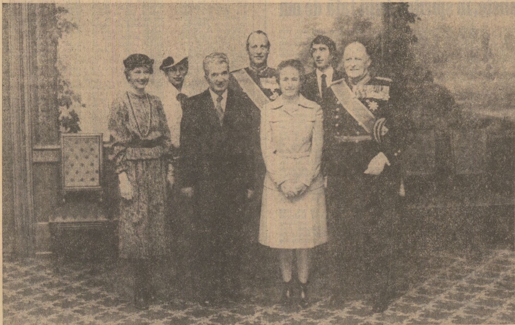
Moment din timpul vizitei la Palatul Regal