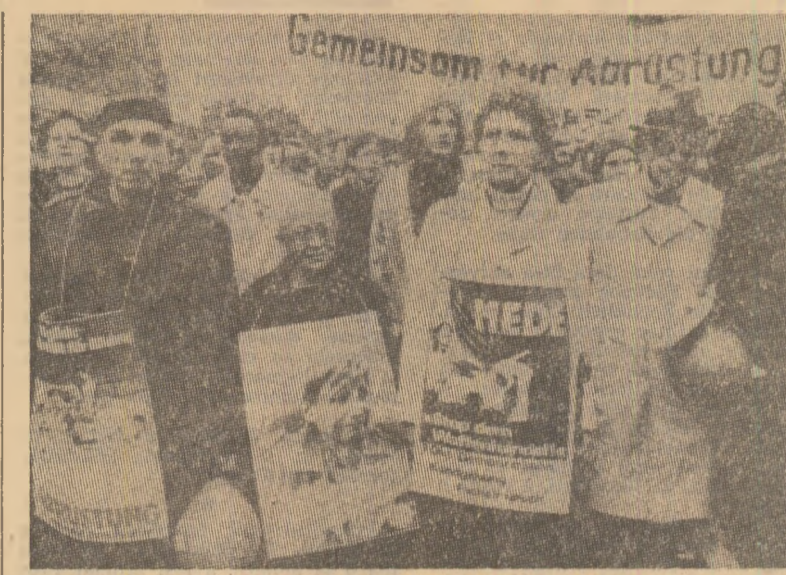
În urma protestelor exprimate de populația orașului Wiesbaden (R.F.G.), comandanții de arme au renunțat să mai organizeze tirul de armament — MEDE. În sprijinul acestei acțiuni au fost inițiate demonstrații ale partizanilor păcii la care au participat și cunoscute personalități ale vieții publice, ca, de pildă, pastorul Martin Niemöller.

Un comunicat dat publicității la încheierea reuniunii apreciază că perspectivele economiei vest-europene n-au generat niciodată atîtea motive de îngrijorare. Șefii de stat și de guvern ai C.E.E. au apreciat că această situație se explică, în primul rînd, prin mărirea pretului petrolului și creșterea rapidă a somajului, acesta din urmă cuprînzînd, în prezent, aproape milioane de persoane din țările Pieței Comune. Reuniunea s-a pronunțat pentru „un efort deosebit” în favoarea tinerilor care caută un loc de muncă. S-a hotărît să fie convocat un consiliu ministerial special consacrat problemelor somajului.