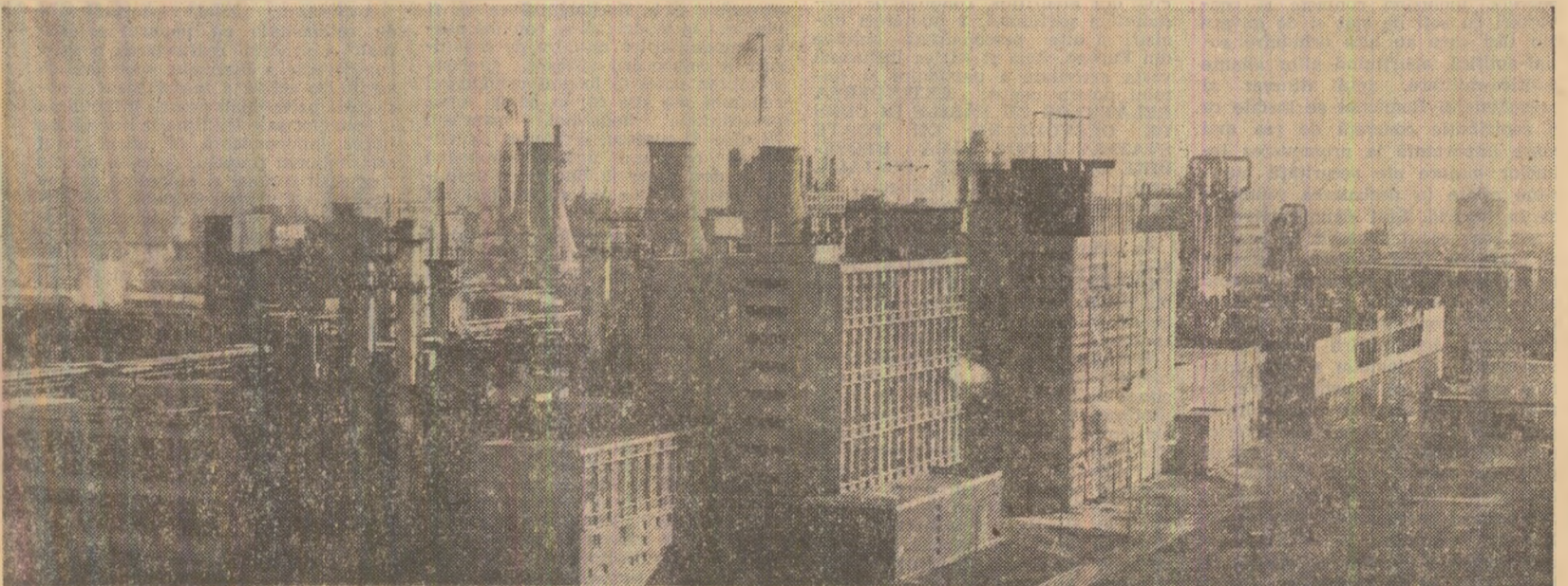
Combinatul de fire și fibre sintetice Săvinești — unitate emblematică pentru Industria Județului Neamț

Insemnări de la Întreprinderea de utilaje și piese de schimb București nărîl în coji de nisip pelculizat pentru cîteva tipuri de plăci răcitor grătar. Desigur, măsurile luate pentru realizarea unei producții de cea mai bună calitate sînt mult mai numeroase. Nu putem să nici nu ne propunem să le prezentăm pe toate. Cînt este că în întreprindere calitatea este privită ca o problemă de prestigiu a întregului colectiv și nici un utilaj nu este livrat pînă cînd nu există certitudinea că el va funcționa în cele mai bune condiții la beneficiar. Iar ca dovadă a prestigiuului cîștigat, întreprinderea a primit recent o comandă din partea firmei „Cliron” pentru execuția unor transportoare, care vor fi montate la noua unitate producătoare de automobile „Oltcit” din Craiova. Subliniind încă o dată că muncitorii și specialiștii întreprinderii duc o adevărată „bătălie” pentru ca la beneficiari să ajungă numai produse de cea mai bună calitate, totuși încă nu s-a cîștigat definitiv „războiul” pentru o înaltă calitate a muncii pe fiecare fază a procesului tehnologic. Nu de mult, la atelierul de strungărie s-a greșit cota de prelucrare a unui ax de rotor pentru ventilator. În mod aproape iminent, piesa, în greutate de peste 1.800 kg, în care se investise multă muncă pînă în acest stadiu al procesului de producție, trebuia să fie rebutată. În