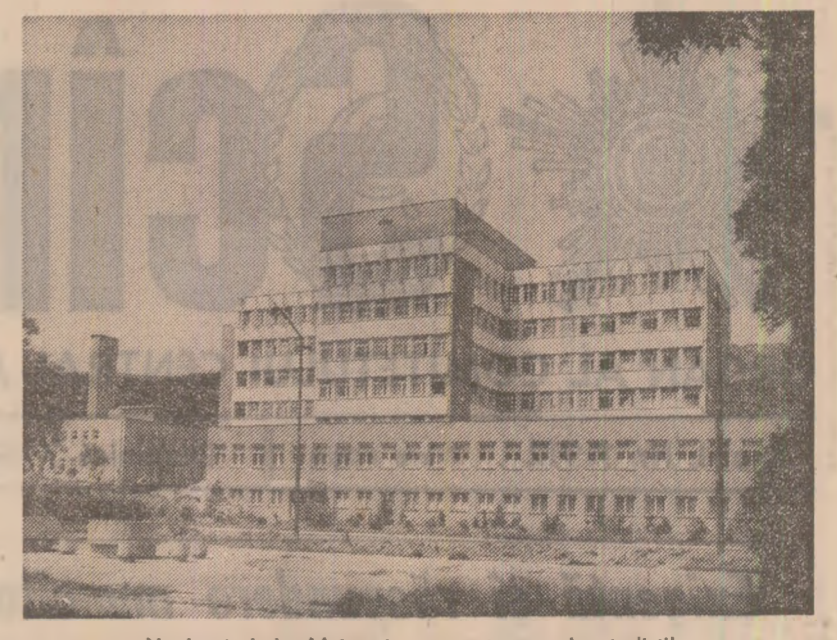
Noul spital din Moinești, cunoscut oraș al petroliștilor