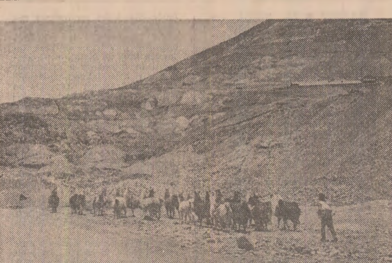
La poalele masivului Potosi, comoară de argint și cositor a Boliviei

„marea india” — un caleidoscop de culori, zgomet și mirosuri, unde se amestecă vînzători, pungași, politici și pașnici „cholost”, care vorbește despre problemele lor financiare. Căci indienii are totdeauna probleme financiare, care de care mai insolubile. Palatul prezidențial din plaza Murillo e o construcție solidă în stil colonial. Frumoasă, dar nu prea înțelegută, căci chiriașii ei s-au mutat de regulă, înainte de a termina vreo renovare. De fapt, în „Palacio Quemador” („palatul ars”) sînt înscrise toate istoria recentă a furunilor politice din Bolivia. În ultimul deceniu căderea a cunoscut numai reforme parțiale și noterminate, căci utilitarii au fost siliți s-o abandoneze în grabă — chiar în pijama, zice-se — înainte de a putea să cugele la estetica interioarelor.