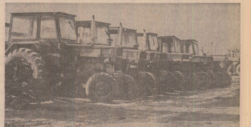
Tractoare imobilizate din cauza lipsei de motorină la S.M.A. Ciorgiria