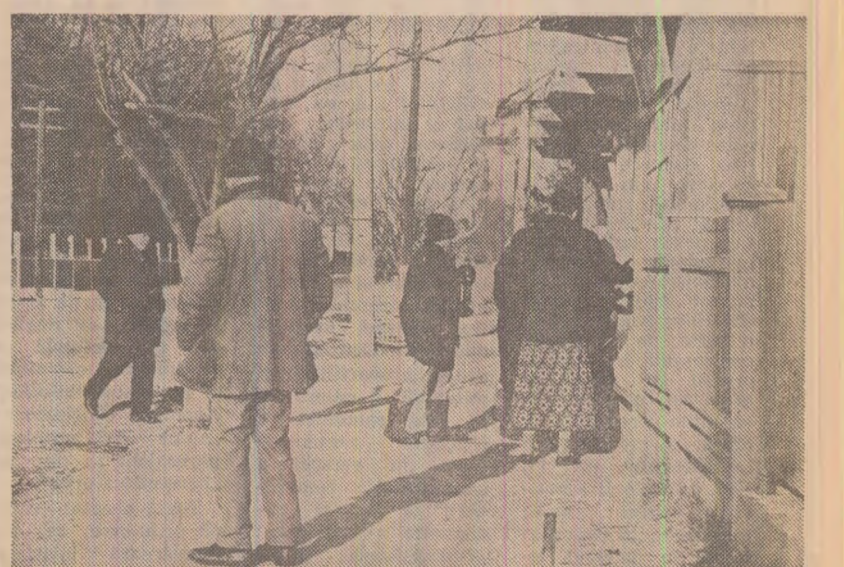
Deși cîmpul îi așteaptă, stau la taclaie pe ulițele comunei Bolintin Deal.