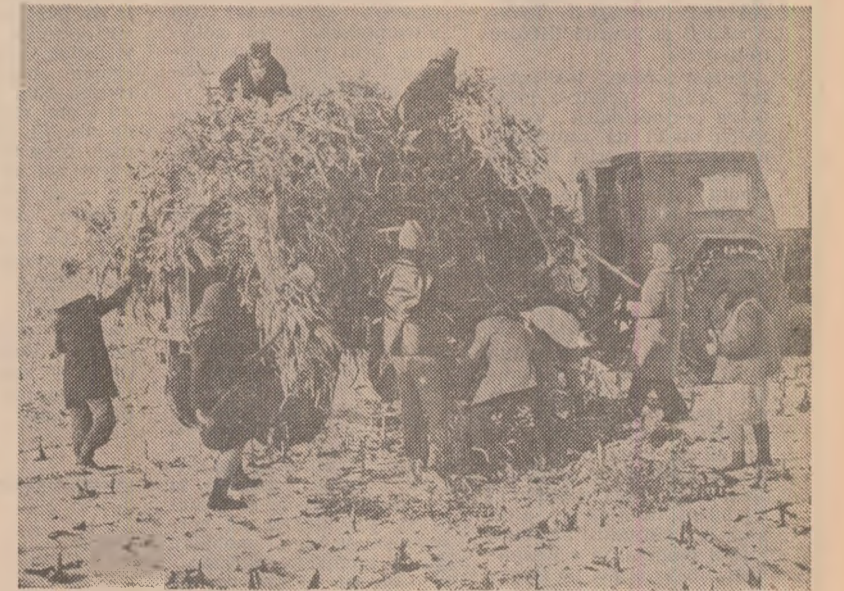
Una dintre echipele de cooperatori de la C.A.P. Bolintin Deal lucrează la transportul cocenilor

Cîți locuitori are comuna? „6.500, zice primarul. Să vedeți, avem mulți zidari, vreo 3.000. Cooperatorii activi sînt 400. Azi avem în cîmp numai 80”. Puțin, dacă ținem seama că în gheț și zăpada și-au făcut apariția, iar pe cîmp mai sînt peste o sută de hectare de coceni, parte în gluci, parte nedăți. Or, este absolut necesar ca toți locuitorii comunei, conform Legii organizării muncii și producției în agricultură, leșilor necrescrite și tradițiilor de hîrnicie ale țărănimii, să participe, cu mic, cu mare, la stringerea recoltei, să nu se