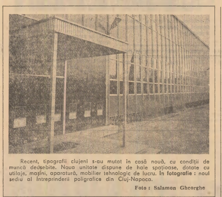
Recent, tipografia clujeană s-au mutat în casă nouă, cu condiții de muncă deosebite. Noua unitate dispune de hote spațioase, dotate cu utilaje, mașini, aparatul, mobilier tehnologic de lucru. În fotografie: noul sediu al întreprinderii poligrafice din Cluj-Napoca.

s-a făcut o astfel de revizie? (Comitetul asociației de locatari din blocul A 5, strada Victoriei, Pitești) ● Cooperarea mestegărească din județul Olh îngreștează acum, la sfîrșitul ultimului an al cîncinalului, un bilanț edificator — o producție de peste 20 milioane lei, livrări de mărfuri la fondul pieței de peste 16 milioane lei, produse exportate în valoare de peste 240 mil lei valută etc. Totodată, a crescut calitatea produselor executate, au scăzut cheltuielile la 1.000 lei producție marfă, a sporit răspunderea pentru atingerea în circuitul producției a cîmă mai multor materii refolosibile — au fost diversificate prețurile de servicii către populație. (Titus Ciortescu, activist cultural, Slatina, județul Olh). ● Sugerăm organelor C.F.R. competente și Oficiului județean de turism Coșava să ia măsuri pentru înființarea în stațiunea Coșava a unui serviciu de turism și de persoane cu diverse afecțiuni — o agenție de voiaj C.F.R. în acest fel, cetățenii ar fi scutiți să mai efectueze cîte 3 drumuri, cale de 5 km, pînă la gara din oras, pentru a obține un bilet de călătorie. (Ion V. Marin, corespondent voluntar).