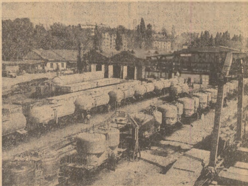
Prin generalizarea unor valoroase inițiative, constructorii de vagoane din Drobeta-Turnu Severin au reușit să economisească, în acest an, 500 de tone de metal, ceea ce echivalează cu metalul necesar pentru realizarea a 42 de vagoane de tipuri diferite

Constructorii din municipiul Bîrlad raportează îndeplinirea planului anual la construcția de locuințe. Avansul cîștigat creează posibilitatea încheierii anului cu un număr de circa 100 de apartamente în plus față de prevederi. În acest fel, în ultimul an al actualului cincinal fondul locativ al Bîrladului s-a dezvoltat cu încă 1.000 de apartamente de care beneficiază tot atîtea familii de oameni ai muncii. Noile ansambluri de locuințe dispun și de importante dotări sociale. Zilele acestea, în zona Gării a fost dat în folosință localul Școlii generale nr. 11 cu 18 săli de clasă. Tot în această clădire este organizată activitatea unei grădinițe cu 120 de locuri. La parterul noilor blocuri s-au început activitatea numeroase unități care asigură servicii publice, comerciale și prestații mestegusărești. (Crăciun Lăluț).