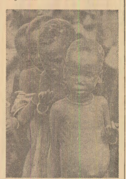
Copii infomaţi din regiunile lovite de secetă

de a finanţa, din resurse proprii, proiectele de irigaţii. Potrivit Comitetului de luptă împotriva secetei din Sahel, aceste proiecte ar necesita investiţii în valoare de un miliard 350 milioane de dolari pe o perioadă de cinci ani, adică cu puţin mai mult decît se cheltuiesc pentru înarmare în lume... într-o singură zi.