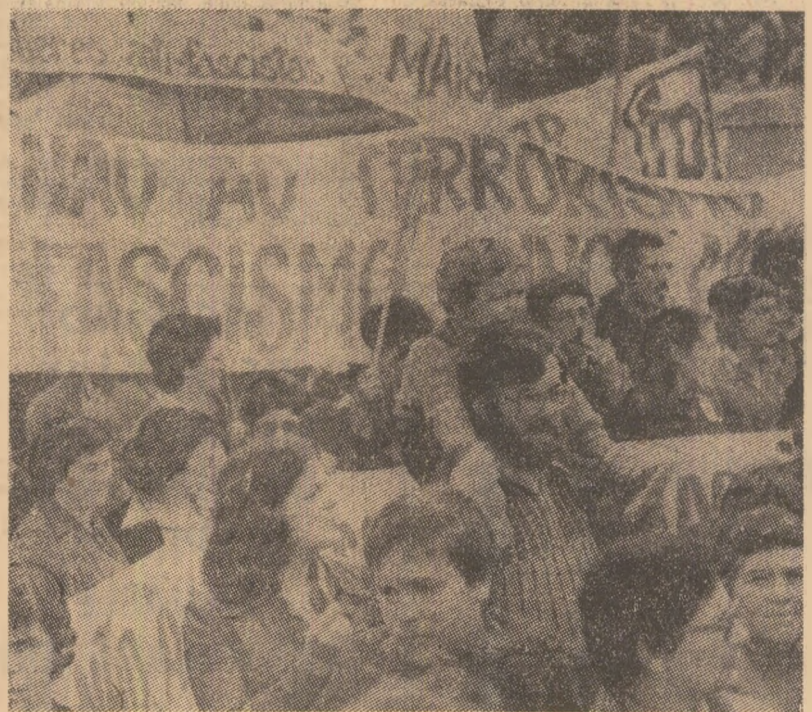
Față de manifestãrile de recrudescență a fascismului, ce au avut loc în ultimul timp în diferite țãri vest-europene, se intensificã acțiunile de protest ale opiniei publice democratice și progresiste, care cere sã se ia mãsuri ferme împotriva organizațiilor fasciste și neonaziste, împotriva terorismului. În fotografie: o imagine de la o mare demonstrație antifascistã, desãsuratã la Lisabona