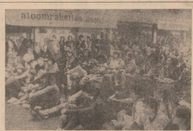
Prin demonstrații organizate în diverse localități ale țării, mil de olandezi și-au manifestat în ultimul timp împotriva fermă față de planurile privind amplasarea de noi rachete nucleare în Europa occidentală. Fotografia înfățișează un aspect din timpul manifestației de la Haga

Cea de-a 38-a sesiune a Comisiei Economice a O.N.U. pentru Europa (C.E.E./O.N.U.), ale cărei lucrări au debutat luni la Geneva, dobândește în acest an semnificații speciale în împrejurările complexe ale situației internaționale și, mai ales, în condițiile când la Madrid se desfășoară fazele finale ale lucrărilor reuniunii generale europene pentru cooperare economică, unde participă reprezentanți ai tuturor statelor membre ale comisiei.