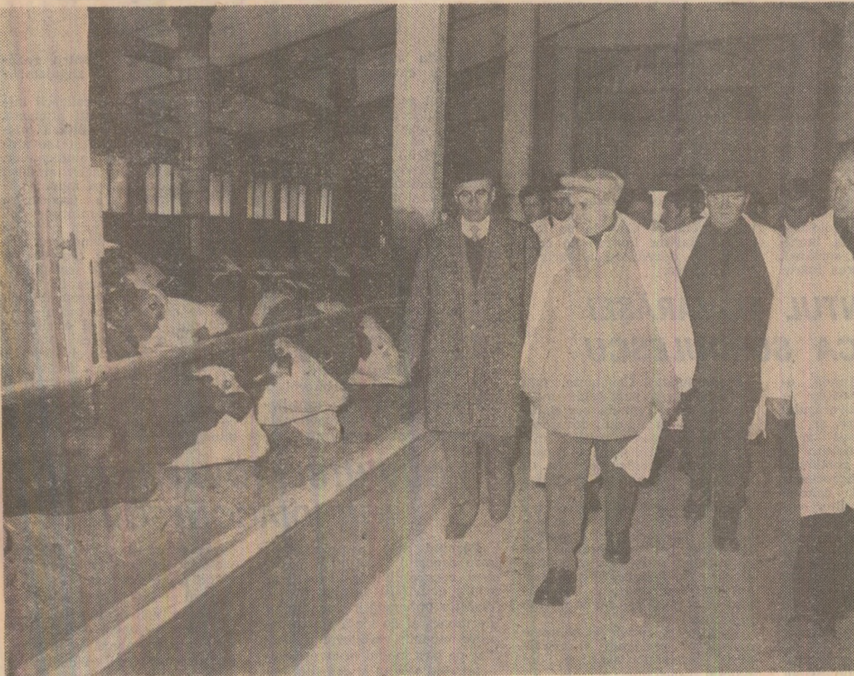
La complexul de creștere și îngrășare a tineretului taurin de la I.A.S. Iernut

PE STINDARDUL PARTIDULUI: obiective de luptă în concordanță cu interesele vitale ale poporului român, ale întregii umanități