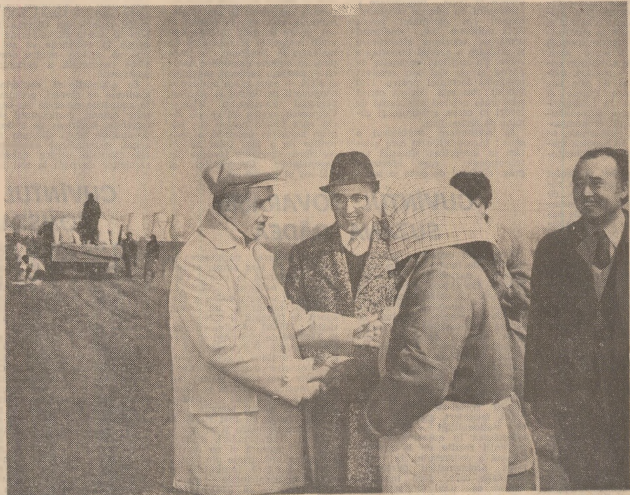
Pe ogoarele unei din unitățile consiliului unic agroindustrial Iernut

Secretarul general al partidului a analizat la fața locului, împreună cu oamenii muncii, cu specialiști din agricultură, modul în care se desfășoară campania agricolă de primăvară, în care se îndeplinesc obiectivele stabilite pentru dezvoltarea zootehniei