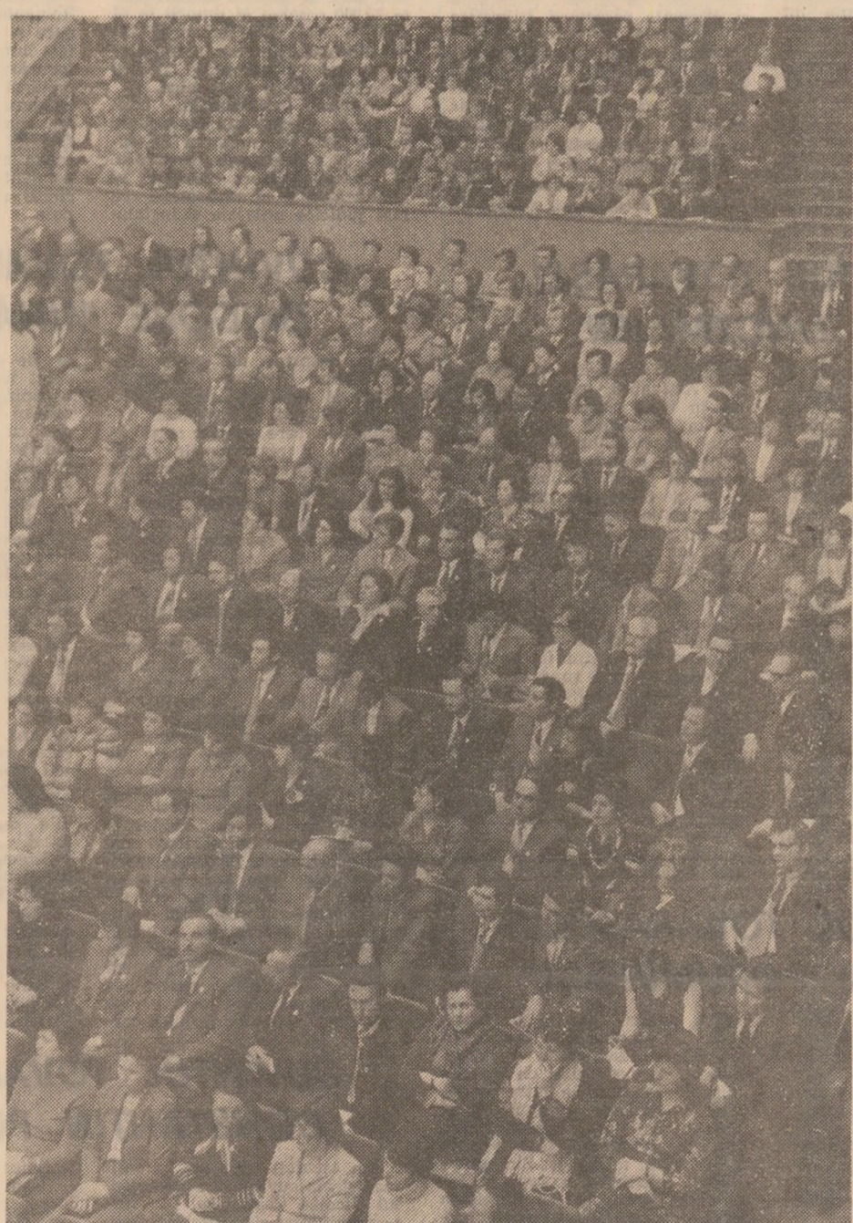
Activişti ai sindicatelor discută problemele de creaţie tehnică şi ştiinţifică de masă.

Au luat cuvîntul 58 tovarăşi — muncitori, tehnicieni, ingineri, activişti ai sindi-