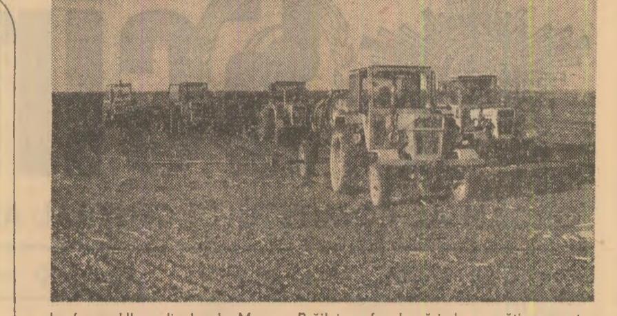
La ferma Ulmu din Insula Mare a Brăilei se fac lucrări de pregătire a patului germinativ în vederea însămînţării porumbului.

„De cîteva ani suferim de pe urma inundărilor unui pîru necanalizat care, în urma ploilor sau a tobirii zăpezilor, îşi iese din mîncă, provocînd pagube” — relatează într-o scrisoare adresată preşedintelui ţării mai mult locuitorii ai Huedinului. În afară de aceasta, ei semnalau că deoarece sosseau naţionala ce trece prin oraş, în zona înălţată cu peste 70 cm, apele provenite din precipitaţii, inclusiv cele reziduale, se adună între calea ferată şi şosea, neavînd loc de scurgere. Tovarăşul Nicolae Ceauşescu a dispus ca scrisoarea să fie dată spre soluţionare secretarului C.C. al P.C.R. şi viceprim-ministrului guvernului, în ale căror atribuţii intră şi aceste probleme. La faşa locului, faşele au fost cercetate de către specialiştii şi reprezentanţii Comitetului teritorial de probleme, Consiliului Popular, Consiliului Naţional al Apelor, Ministerului Transporturilor şi Telecomunicaţiilor. A rezultat că cele trei cartiere aflate în jurul unităţii — Horea, Florilor şi Abator — au fost construite în urmă cu peste 40 de ani, în prezent construcţiile avînd un