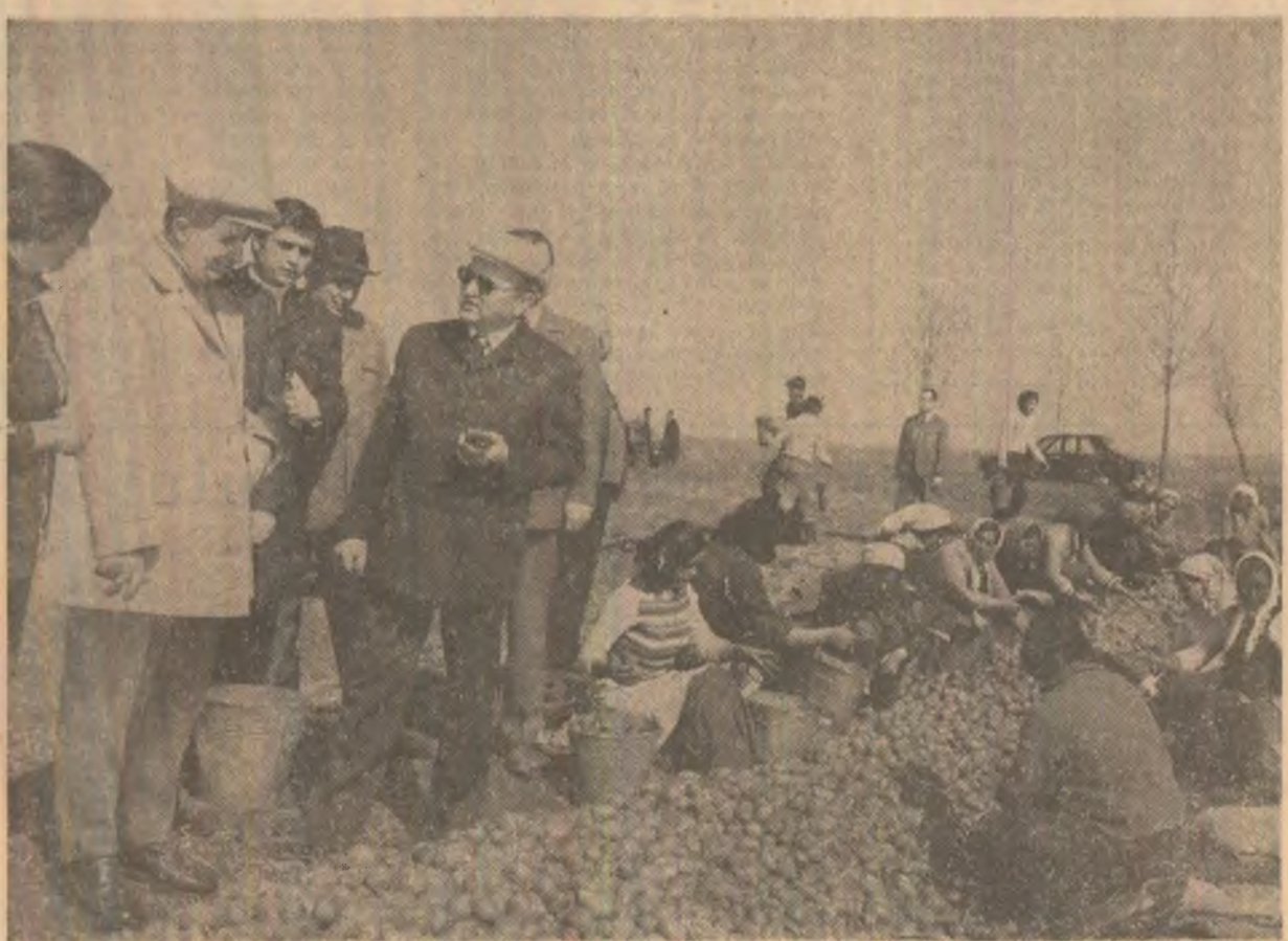
La întreprinderea agricolă de stat „Sfințu Gheorghe”

Despărțirea de locuitorii județului Covasna are loc în aceeași atmosferă plină de însuflețire cu care este înconjurat pretîndînd secretarul general al partidului. Oameni al muncii, tineri și vîrstnici, purtau cu dragoste vizitului tovarășului Nicolae Ceaușescu, steaguri roșii și tricolor, pancarte pe care erau înscrise numele secretarului general al partidului într-o simbolică și firească alăturare cu numele partidului și al țării. Ei au aplaudat cu deosebită căldură, ovationînd îndelung. Buchetele de flori oferite de cel mai tineri cetățean al județului — pionierii și soimii ai patriei — au subliniat aceste momente de reală emoție. O sardă militară a prezentat onor. Fanfara a intonat Imnul de stat al Republicii Socialiste România. În numele locuitorilor din această parte a țării — români și maghiari — primul secretar al Comitetului Județean de partid Covasna a mulțumit din adîncul inimii tovarășului Nicolae Ceaușescu pentru această nouă vizită, exprîmînd angajamentul lor de a acționa fără înfrîiere pentru a transpune în practică indicțiile primite, de a asigura înflăcărea întocmai a programului de dezvoltare și modernizare a județului în actualul cincinal.