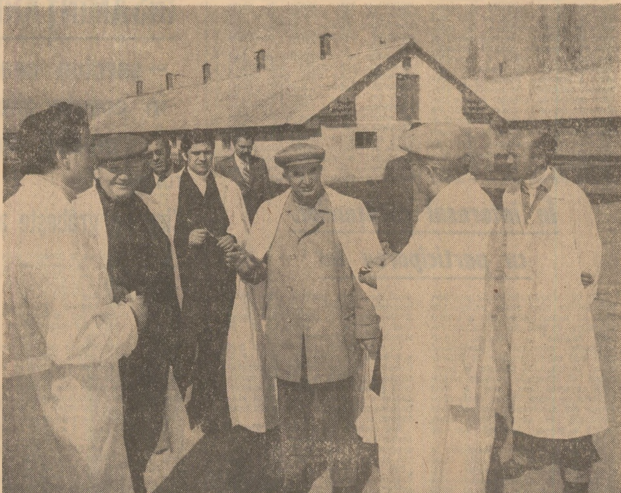
În timpul vizitei la ferma Anghelșu

Tovarășul Nicolae Ceaușescu, secretar general al partidului, președintele Republicii, a efectuat joi o vizită de lucru în unități agricole din județul Covasna. Secretarul general al partidului a fost însoțit de tovarășul Iosif Banc, membru al Comitetului Politic Executiv, secretar al C.C. al P.C.R.