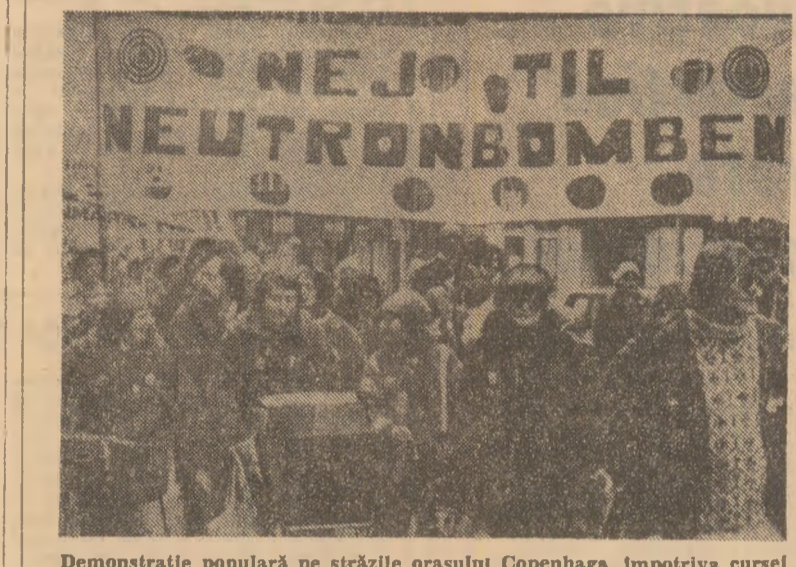
Demonstrație populară pe străzile orașului Copenhaga împotriva cursei înarmării, pentru reînnoirea proiectelor de amplasare în Europa occidentală a noi tipuri de arme nucleare