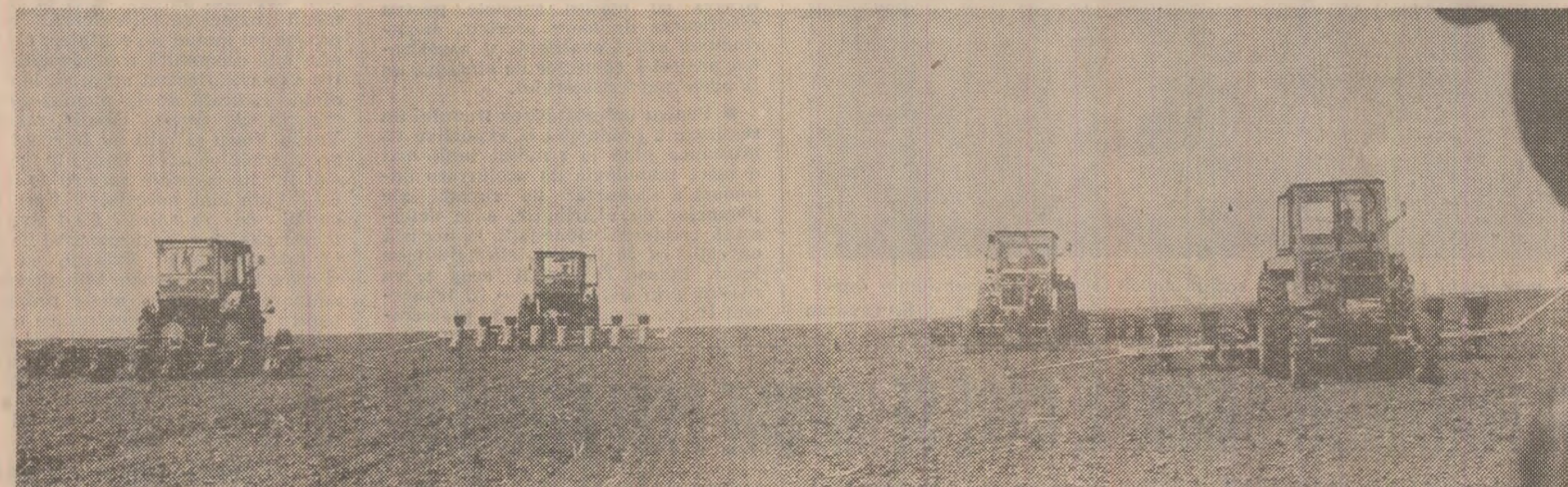
La C.A.P. Gherghița, județul Prahova, prin buna organizare a muncii, însămințarea porumbului avansează în ritm rapid.

Timpul este înaintat, vremea este bună în toată țara și, de aceea, nu precupețiți nici un efort pentru intensificarea la maximum a ritmului lucrărilor, muncind cu răspundere din zori pînă seara la semănat și în două schimburi la pregătirea terenului!