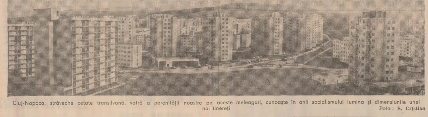
Cluj-Napoca, străveche cetate transilvănească, vîtră a perenității noastre pe aceste meleaguri, cunoaște în anii socialismului lumina și dimensiunile unei noi înțelegeri.

— Comisiile permanente de deputați pentru construcții, gospodărire comunală și sistematizare — ne spune tovarășul arh. Eikán Georgeș,