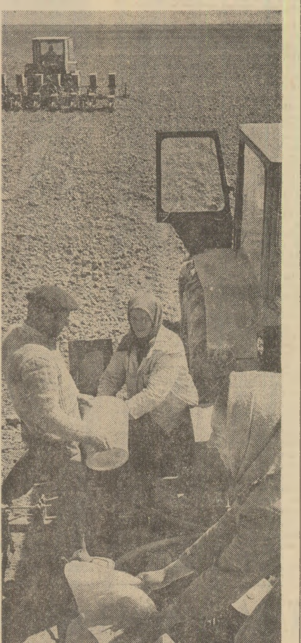
La C.A.P. Dobruș, ritmul la însămînțarea porumbului este zilnic depășit

nam organizarea perfectă a fiecărui loc de muncă, în sensul că alimentarea cu carburanți, aprovizionarea cu semînt și remedierea defecțiunilor la mașini să se facă direct în cîmp, fără pierdere de timp. În felul acesta am ajuns pe trusă la un ritm mediu zilnic de circa 800 hectare, ceea ce ne permite să încheiem însămînțarea porumbului pînă pe 20—21 aprilie. Succint, iată un mod de organizare a muncii, de mobilizare a forțelor care a permis ca întreprinderile agricole de stat din județul Dimbovița să însămînțeze cu porumb, pînă pe 15 aprilie, peste 30 la sută din prevederile, medie superioară celei din cooperativele agricole. Din păcate, nu este tot așa în celelalte județe. Este o bună organizare.