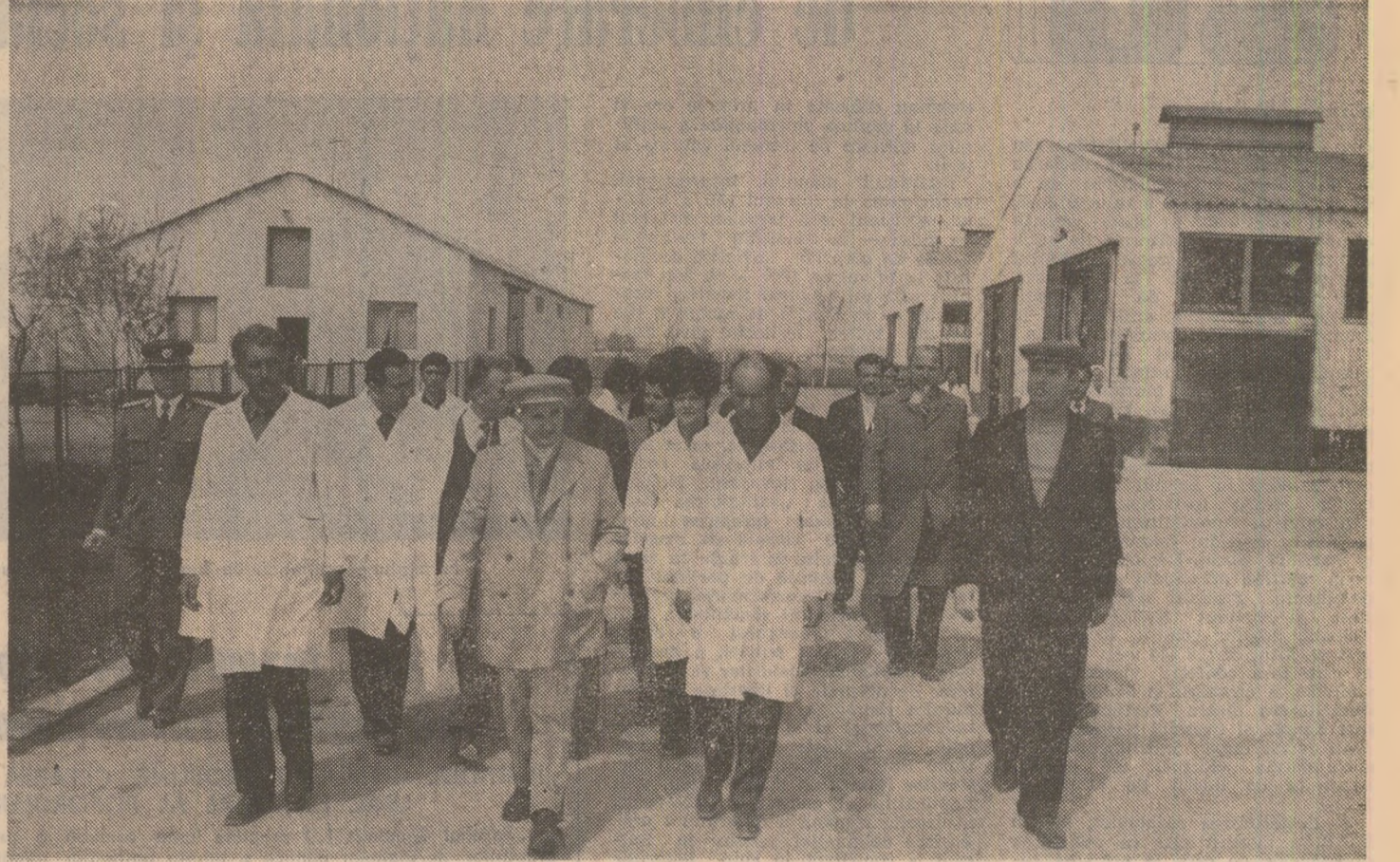
La asociația economică zootehnică de la Bradu