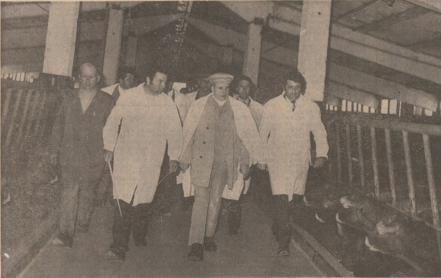
Discutind despre remarcabilele rezultate ale crescătorilor de animale de la Câteasca