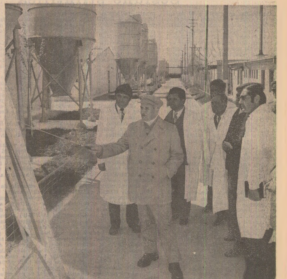
La Teiu, discuție directă, practică, despre modernizare și eficiență