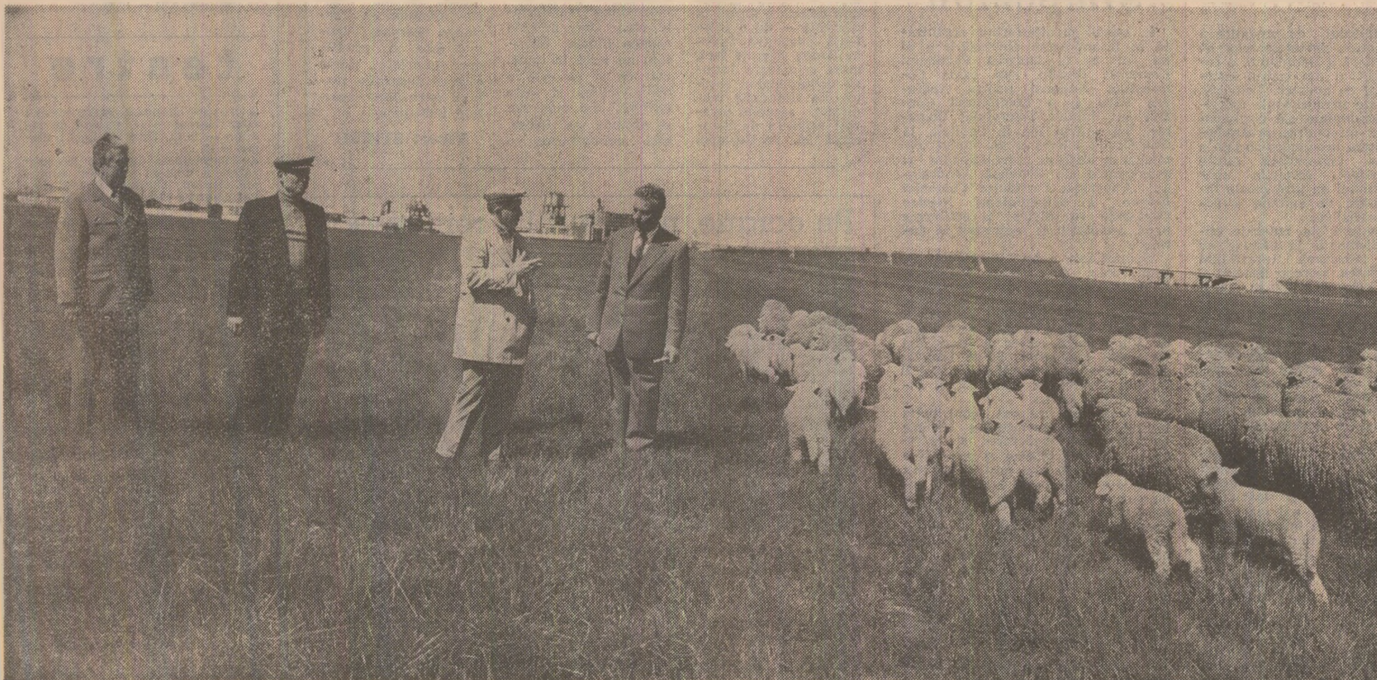
Tovarășul Nicolae Ceaușescu îl sînt înfățișate rezultatele muncii zootehniștilor

La decolarea elicopterului prezidențial răsună din nou aplauze și urale la adresa partidului nostru comunist, a patriei socialiste, a conducătorului nostru iubit.