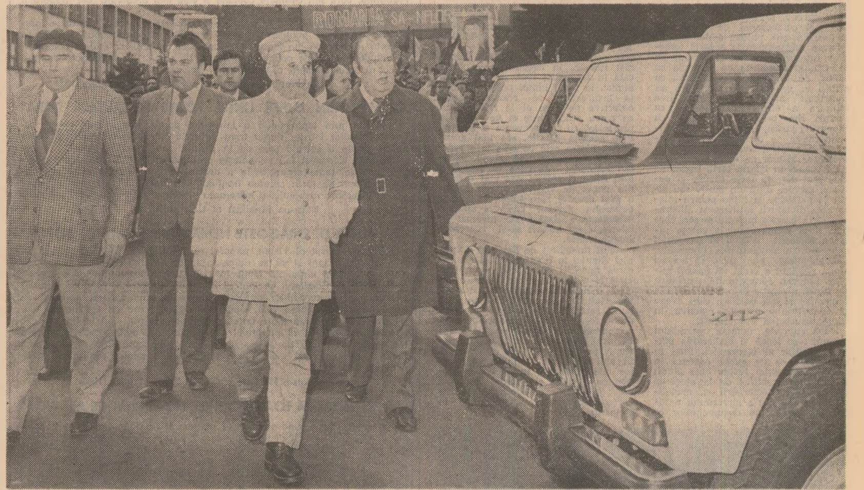
Printre cei care făuresc prestigioasele autoturisme de teren „ARO”

Ultimul obiectiv înscris în agenda zilei de lucru în județul Argeș a fost ÎNTEPRINDEREA MECANICĂ