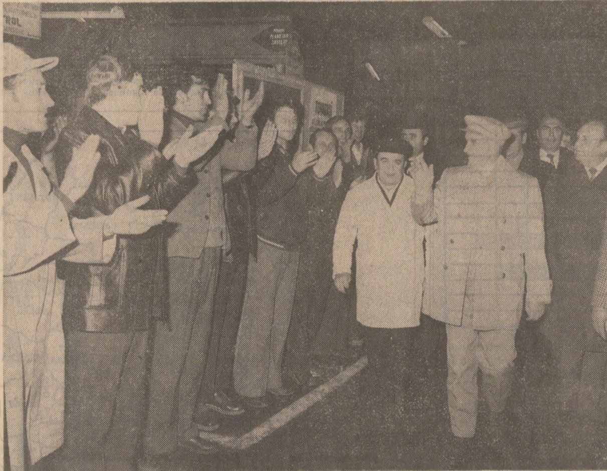
Cu bucurie și dragoste l-au primit pe tovarășul Nicolae Ceaușescu, cetățenii Piteștiului

• Fructuos dialog de lucru cu lucrătorii din unități agricole argeșene despre creșterea producției zootehnice, ameliorarea raselor de animale, asigurarea bazei furajere, creșterea eficienței. • Vizitînd întreprinderile constructoare de automobile și autoturisme de teren, secretarul general al partidului a dat importante indicații privind modernizarea și diversificarea producției, creșterea ei calitativă.