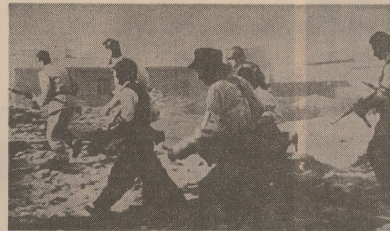
Formațiune patriotică de luptă în zilele lui August '44

Realismul planului insurrecțional, participarea în întregul său a armatei, sprijinul larg popular, avansul de masă a marșului favorabil creat de ofensiva sovietică declanșată la 20 august 1944 — au fost factorii care au asigurat triumful însușirii și în decurs de numai 6 zile practic a întregii țări fiind curățată de inamic.