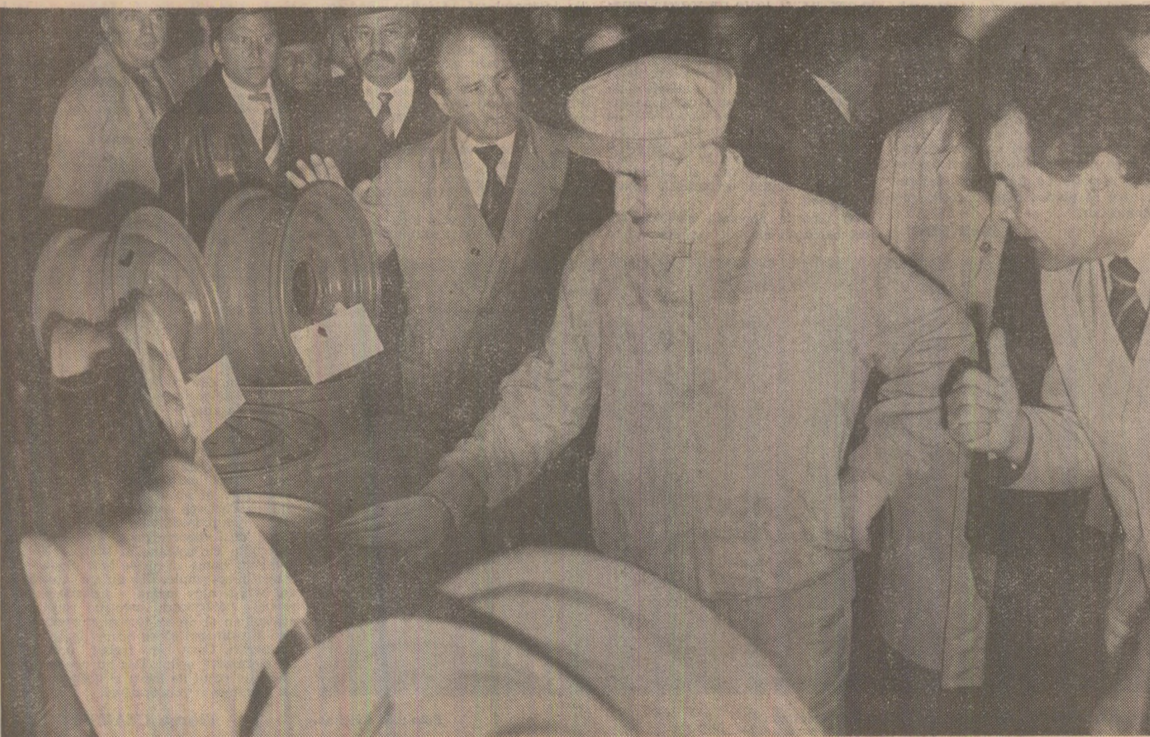
Între constructorii de autoturisme „Dacia”