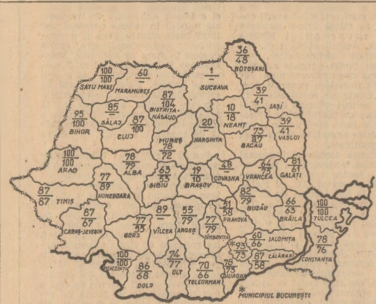
Cifrele înscrise pe hartă reprezintă, în procente față de plan, suprafețele însămînțate cu porumb în cooperativele agricole (cifra de sus) și în întreprinderile agricole de stat (cifra de jos) pînă în seara zilei de 21 aprilie (ieri județul Buzău și sectorul agricol Ilfov al municipiului București au încheiat semănatul acestor culturi).

Lucrările sînt mult avansate și în alte județe. (Relatări în pag. a III-a).