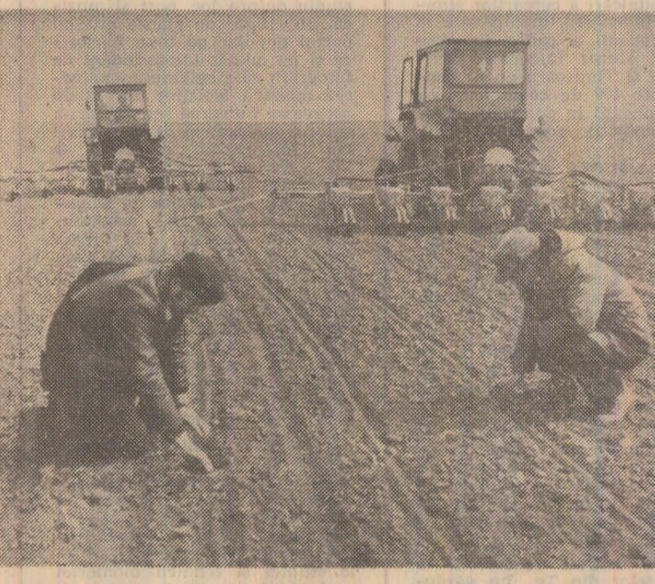
La C.A.P. Pufești-Vrancea se însămînțează porumbul pe ultimele suprafețe. Despre terminarea însămînțării porumbului în județele Argeș, Covasna și Vrancea, precum și despre activitatea desfășurată ieri pe ogoare în alte județe — relatări în pagina a III-a