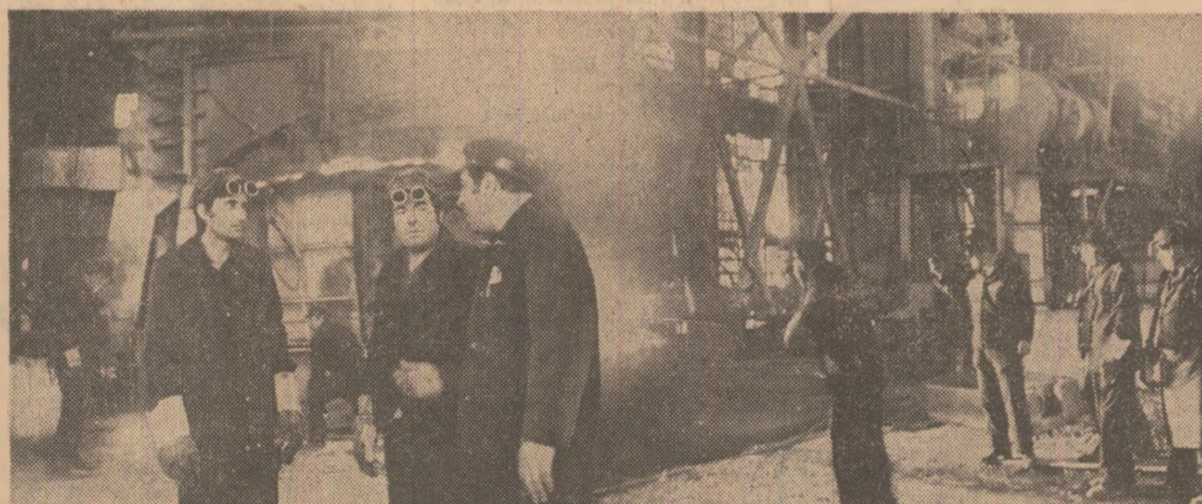
lată-l în imagine pe autorii succesului de la I.M.G.B., cei care dau țării de oțel cuvîntului muncitoresc